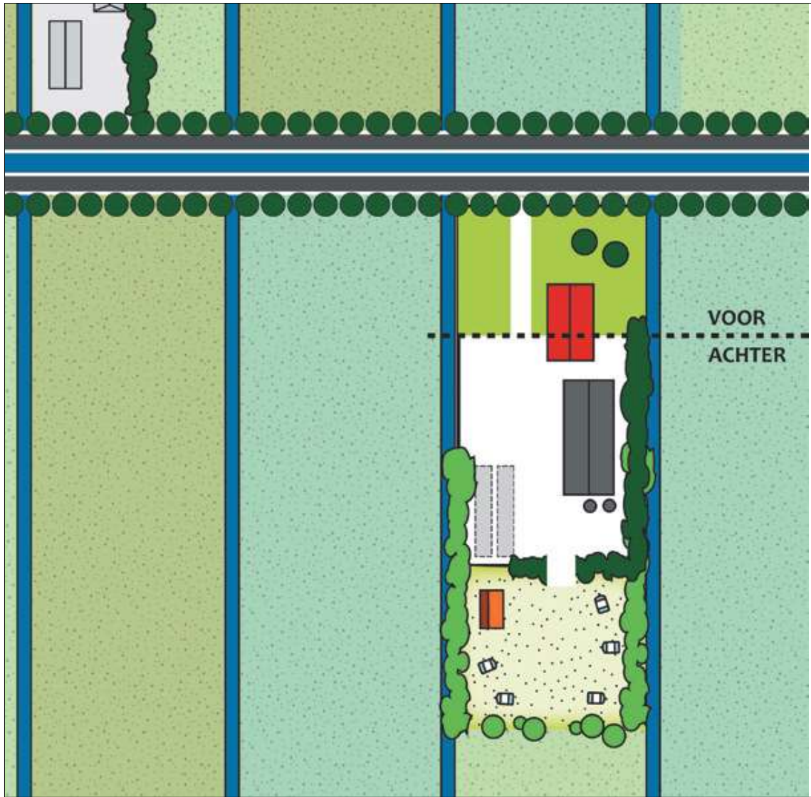
Voorbeeld inpassing bij een agrarisch bedrijf