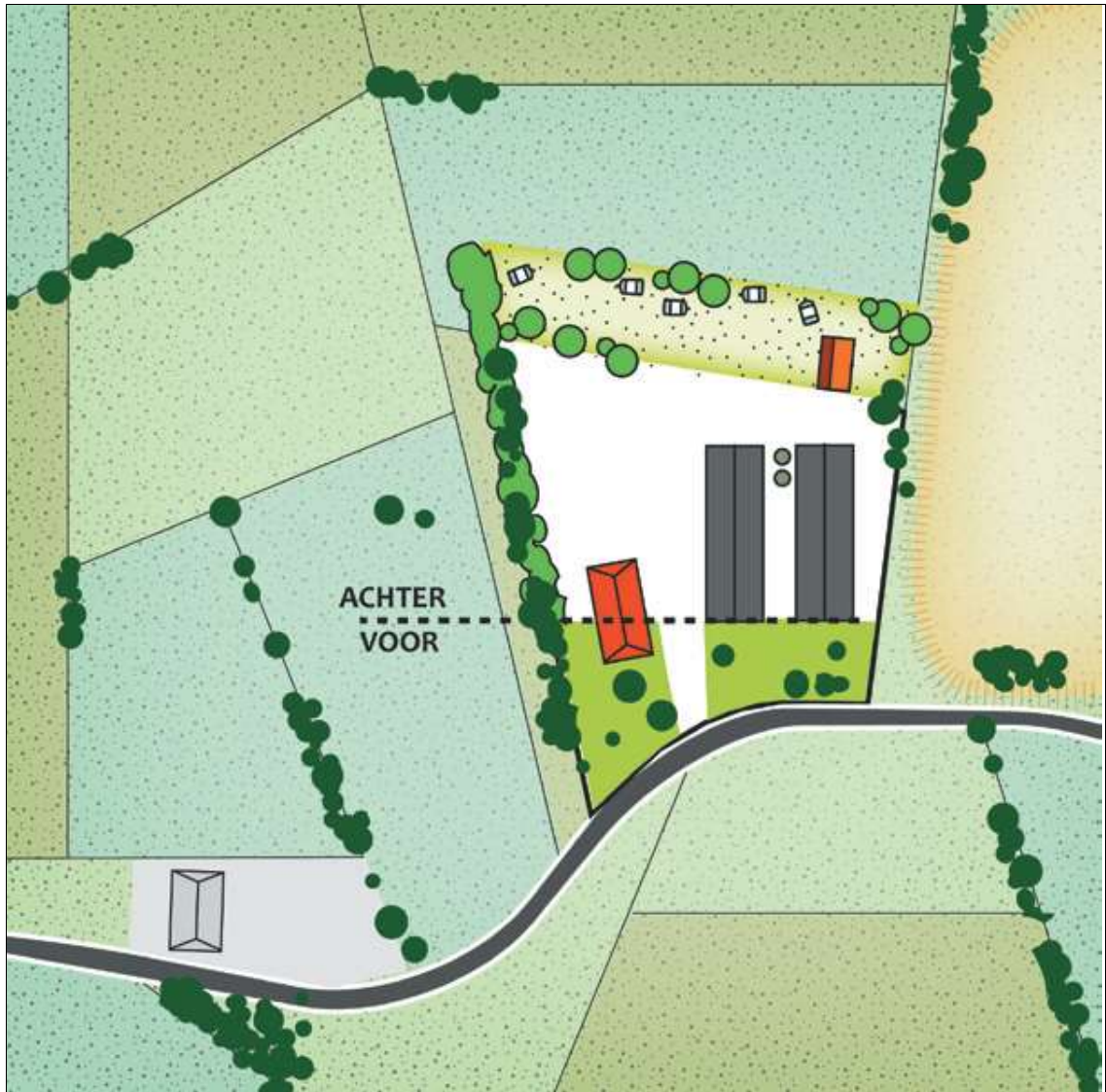
Voorbeeld inpassing bij een agrarisch bedrijf