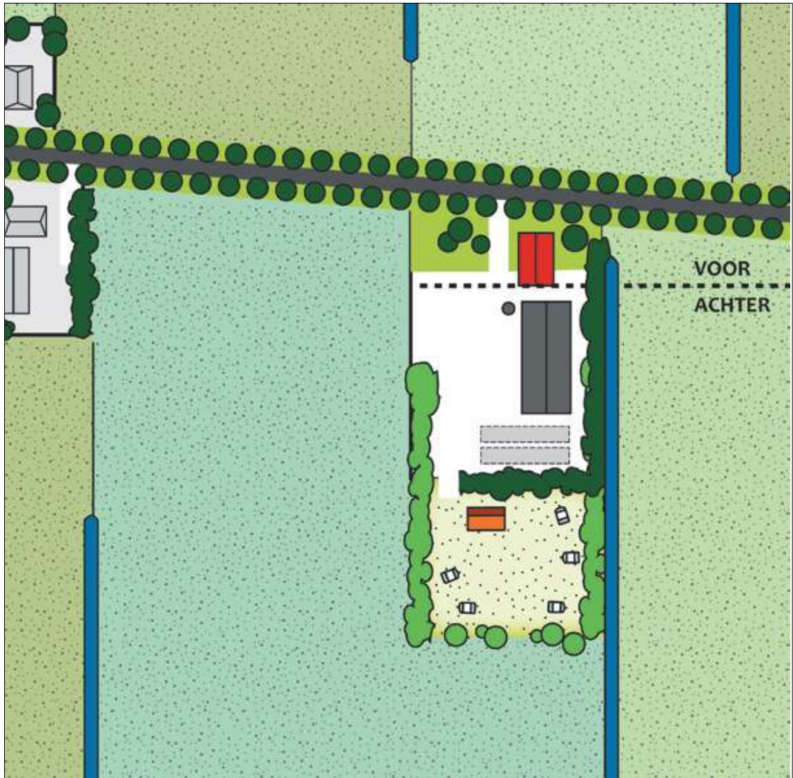
Voorbeeld inpassing bij een agrarisch bedrijf