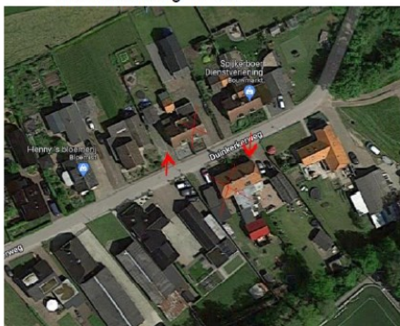
Figuur 1. Globale ligging (boven) en aanduiding te renoveren woningen aan de Schiksweg 11, 13, 23 en 25, Van Oldebarneveldweg 21 en 25, Duinkerkerweg 11 en 14 te Oosterwolde.