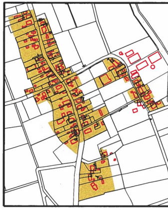
4. BAAIDUJNEN, KINNUM