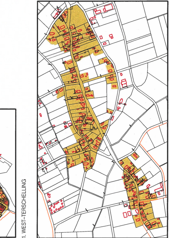
6. LANDERUM, FORMERUM