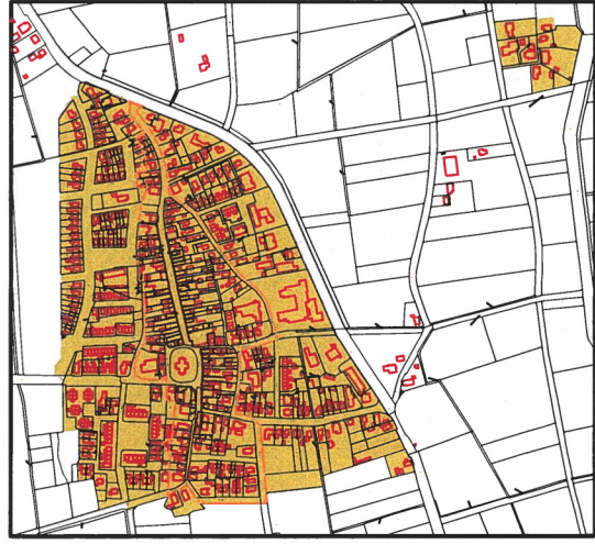
5. MIDLAND, STRIEP