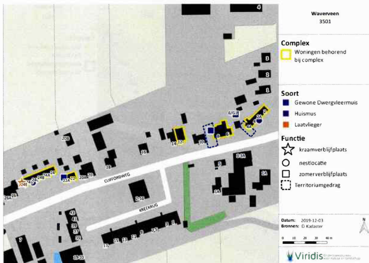
Figuur 2. Resultatenkaart complex 3501, Waverveen. Correcte aantallen gewone dwergvleermuis (huismus in figuur 3)

Bron: "2021-044 Groenwest activiteitenplan en ontheffingsaanvraag complex 3501 te Waverveen" van 26 februari 2021