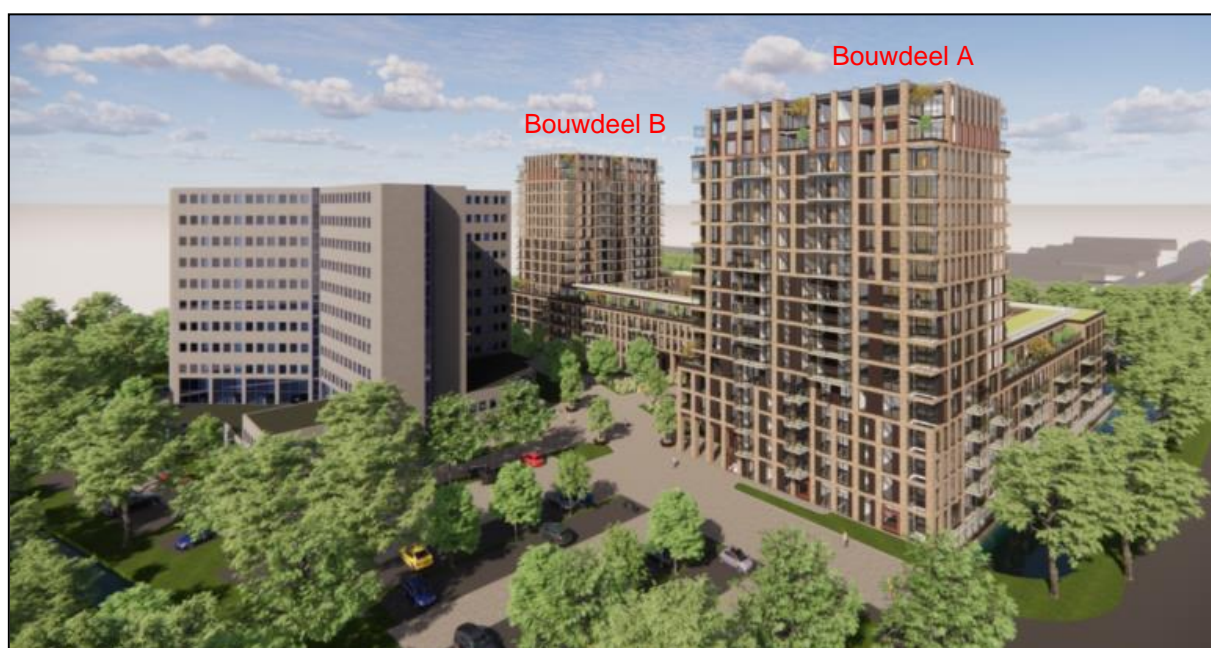
Figuur 2: Artist impressie vanuit oostelijke richting gezien