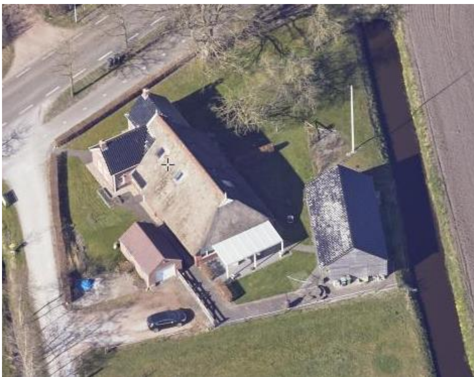
Figuur 2: Luchtfoto geplaatste schuur.

De vergunningaanvraag is bij waterschap Noorderzijvest geregistreerd onder het zaaknummer Z/22/056174 en omvat de volgende voor dit besluit relevante stukken: