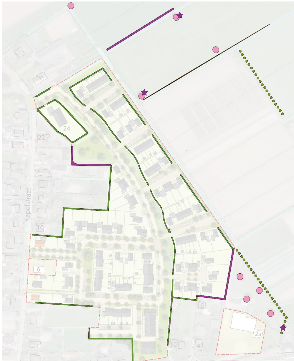
Figuur 2: mitigerende maatregelen voor de steenuil. Paarse sterren geven globaal de locaties van de steenuilenkasten weer, de roze stippen nieuw aan te planten fruit dragende planten, de groene stippellijn nieuwe knotwilgenrijen en de paarse lijnen houtwallen van minimaal 2 meter breed (Urban Jazz, 2021)