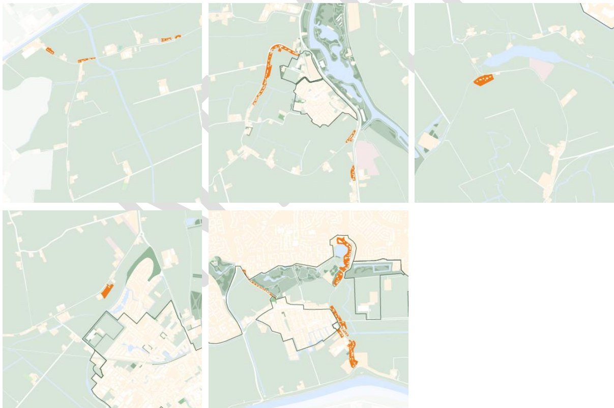
Woonlinten in Nissewaard

Bij linten gaat het om aaneengesloten bebouwing langs één of beide zijden van een dijk of weg. Een lint kan uit woonhuizen, bedrijven, boerenerven of een combinatie ervan bestaan. In dit beleid wordt, als het om linten gaat, specifiek woonlinten bedoeld. Het zijn linten die uitsluitend uit woonhuizen bestaan die van oorsprong als woonhuis zijn gebouwd en zijn bestemd voor de functie wonen. Kenmerkend voor deze woonlinten is dat er geen sprake is van tweedelijsbebouwing of grote stallen en schuren. Op de kaarten hieronder zijn de woonlinten in Nissewaard aangeduid. De lintbebouwing in Biert wordt gekenmerkt door boerenerven en is dus geen woonlint.