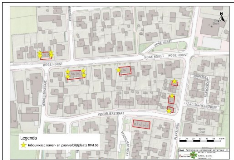
Figuur 30. Geplande locaties inbouw vleermuis kasten IB VL 06 gewone dwergvleermuis in de toekomstige situatie (gele ster, totaal twaalf inbouwkasten).