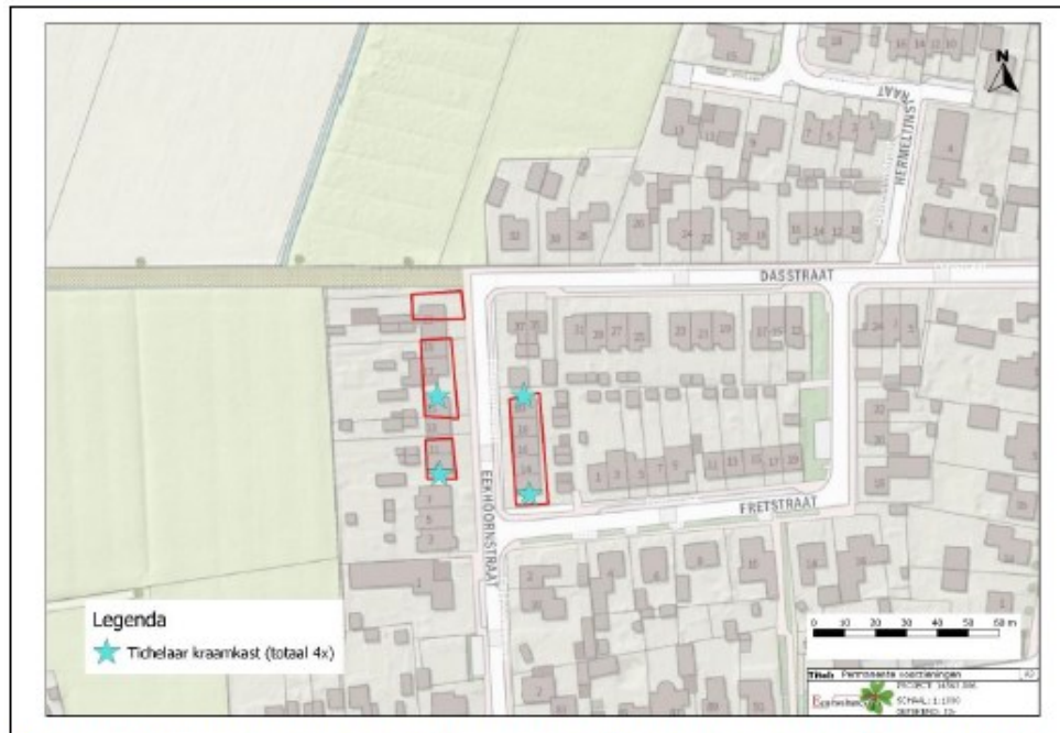
Figuur 29. Geplande locaties inbouw Tichelaarkast gewone dwergvleermuis in de toekomstige situatie (blauwe ster, totaal vier inbouwkasten).