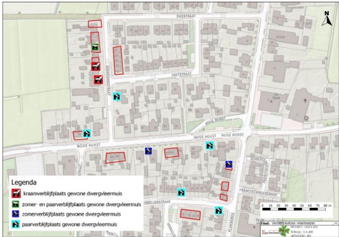
Figuur 3. Aangetroffen verblijfplaatsen gewone dwergvleermuis.