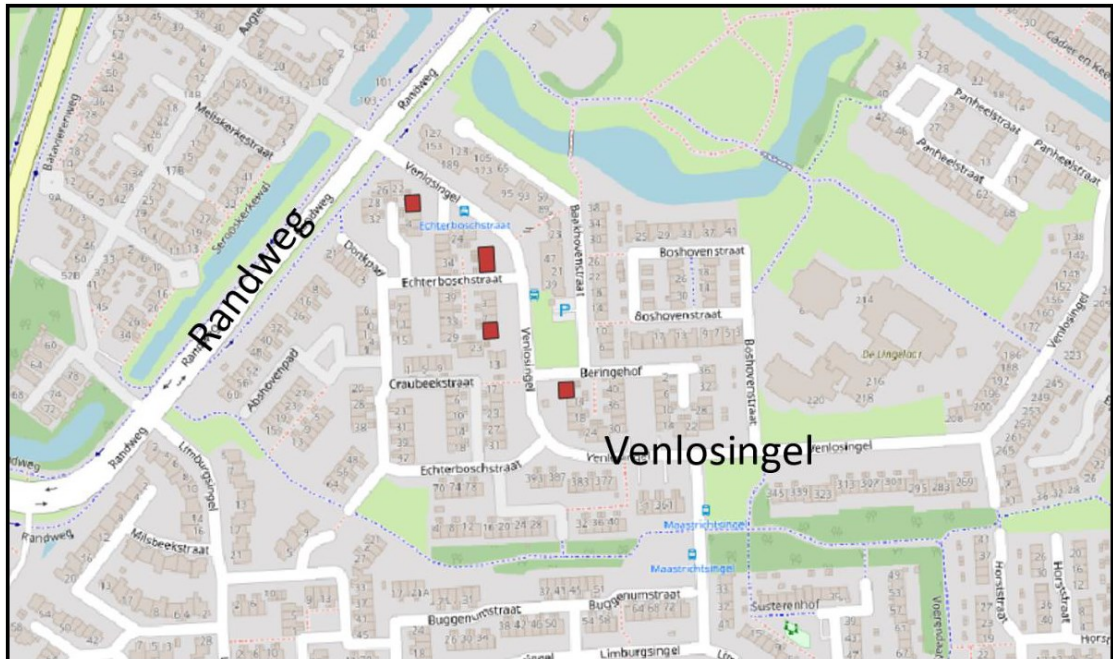
Figuur 1. Ligging van de wooncomplexen in de wijk De Laar in Arnhem waar de houtwolcementplaten worden vervangen. Van boven naar beneden: Bouwberghof 8-18, Bakheidehof 2-18, Bakheidehof 13-19 en Asbroekhof 2-12 te Arnhem.