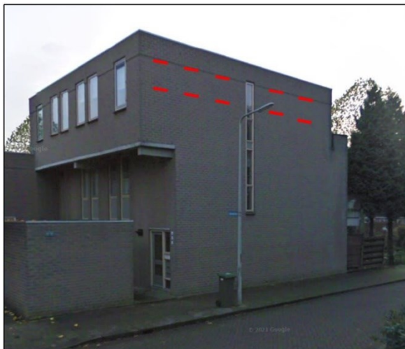
Figuur 2. Locaties van de permanente voorzieningen voor de huismus: complex aan de Bouwberghof (linksboven); complex aan de Bakheidehof 13-17 (rechts); complex aan de Asbroekhof (linksonder).