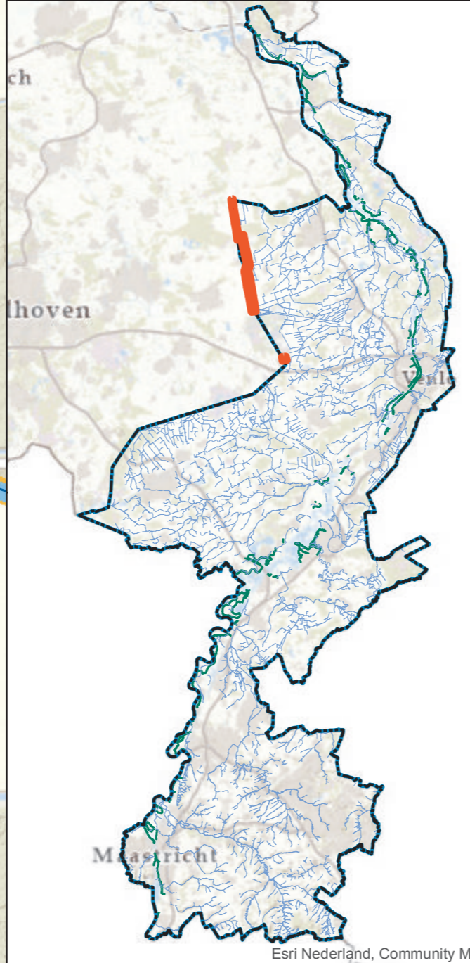
Overzichtskaartje (schaal 1:650.000)