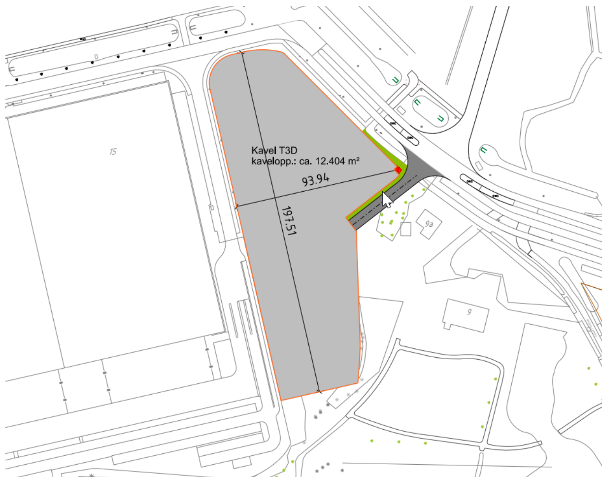
Figuur 1: Plangebied