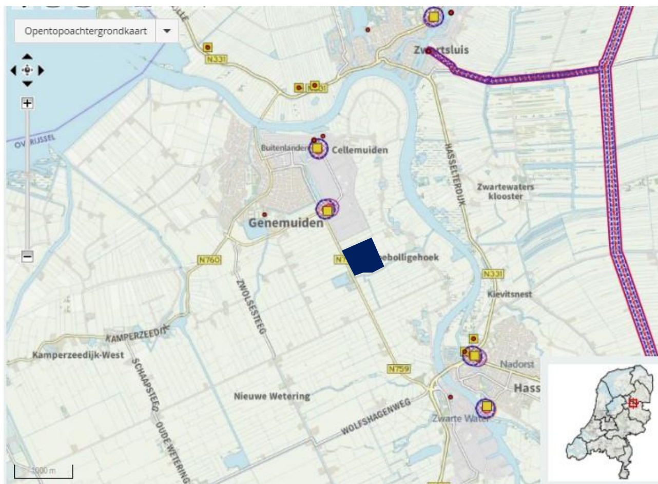
Afbeelding 1: Uitsnede risicokaart en plangebied (donkerblauw vlak) (bron: EV-signaleringskaart).

In en nabij het plangebied zijn geen LPG stations aanwezig, die onder de werkingssfeer van het Bevi vallen. De plaatsgebonden risicocontouren en het groepsrisico zijn derhalve niet relevant.