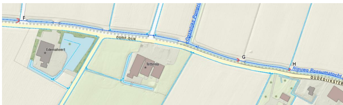
Locatie F t/m H