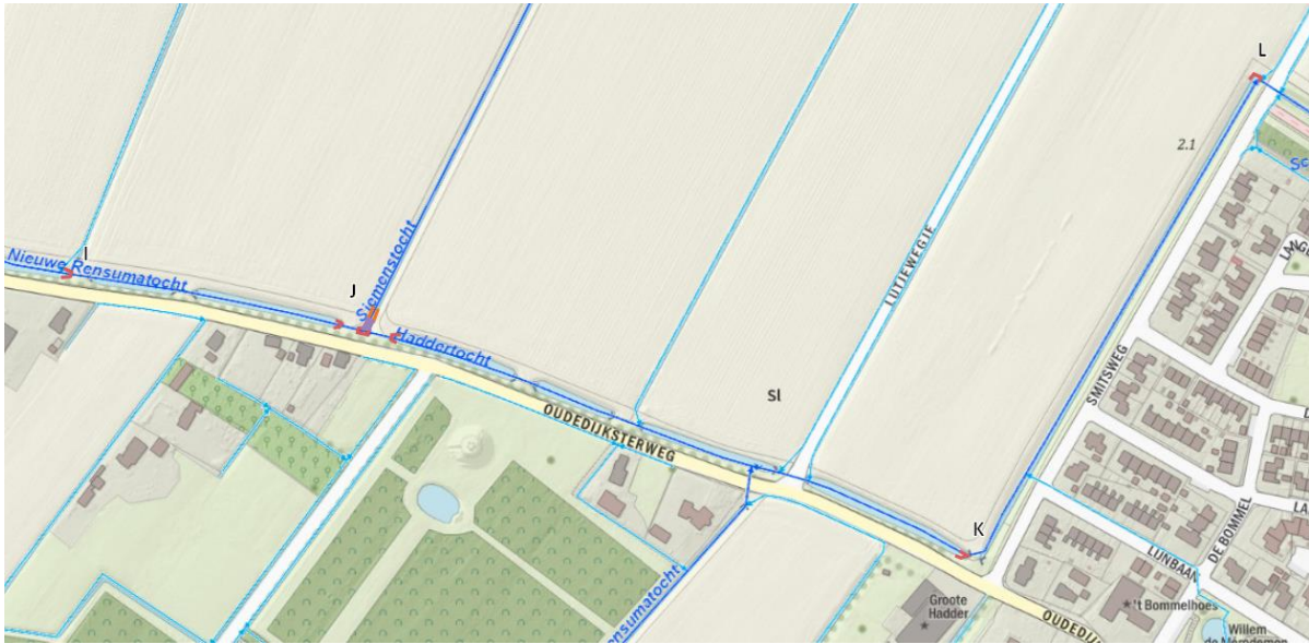
Locatie I t/m L