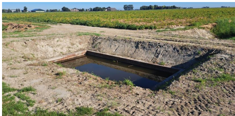
Foto nieuwe situatie