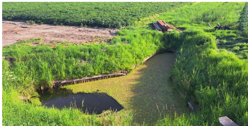
Foto oude situatie