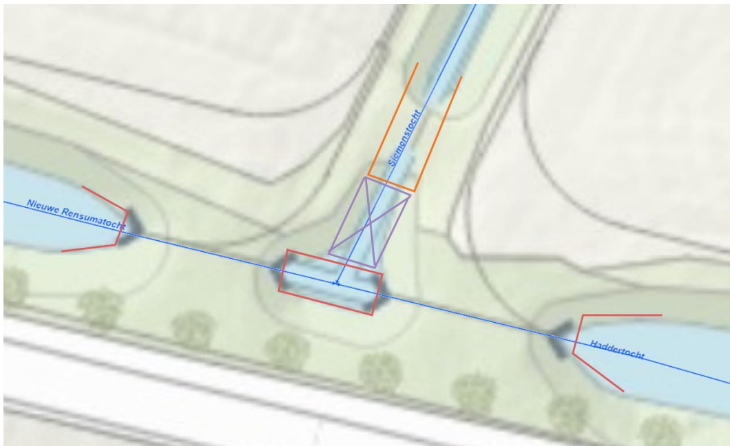
Rood = nieuwe damwand / oranje = nieuwe beschoeiing / paars = nieuwe locatie maaidam met bestaande duiker

Op locatie J gaan we naast het vervangen van de damwanden ook nog een maaidam aanpassen. Om de Siemenstocht te kunnen 'oversteken' is het noodzakelijk om de Siemenstocht aan de zuidzijde te passeren. Reden hiervoor is dat de maaidam te ver naar het noorden ligt, eigenlijk buiten het doorgaande maaipad. Door de 'kom' op de driesprong aan te passen en de maaidam daarin 10 meter naar het zuiden te verplaatsen kan het brede maaipad gewoon gevolgd worden. De bestaande duiker zal op gelijke BOK hoogte in de nieuwe dam gelegd worden, dit levert dus geen grote aanpassing op in het watersysteem. In onderstaande plattegrond wordt de aanpassing weergegeven: