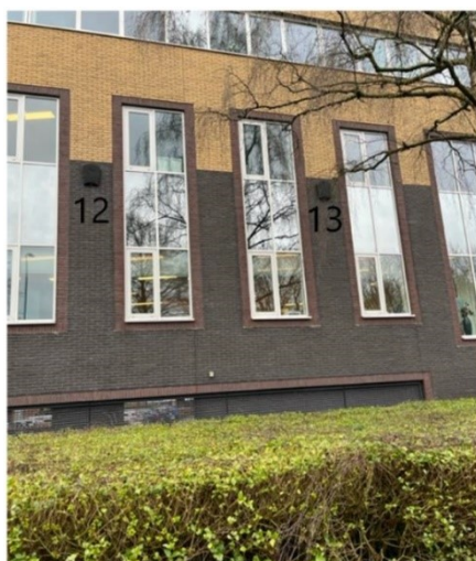
Figuur 3. Voorbeeld van twee opgehangen tijdelijke vloermuiskasten aan het gebouw ten westen van het plangebied.