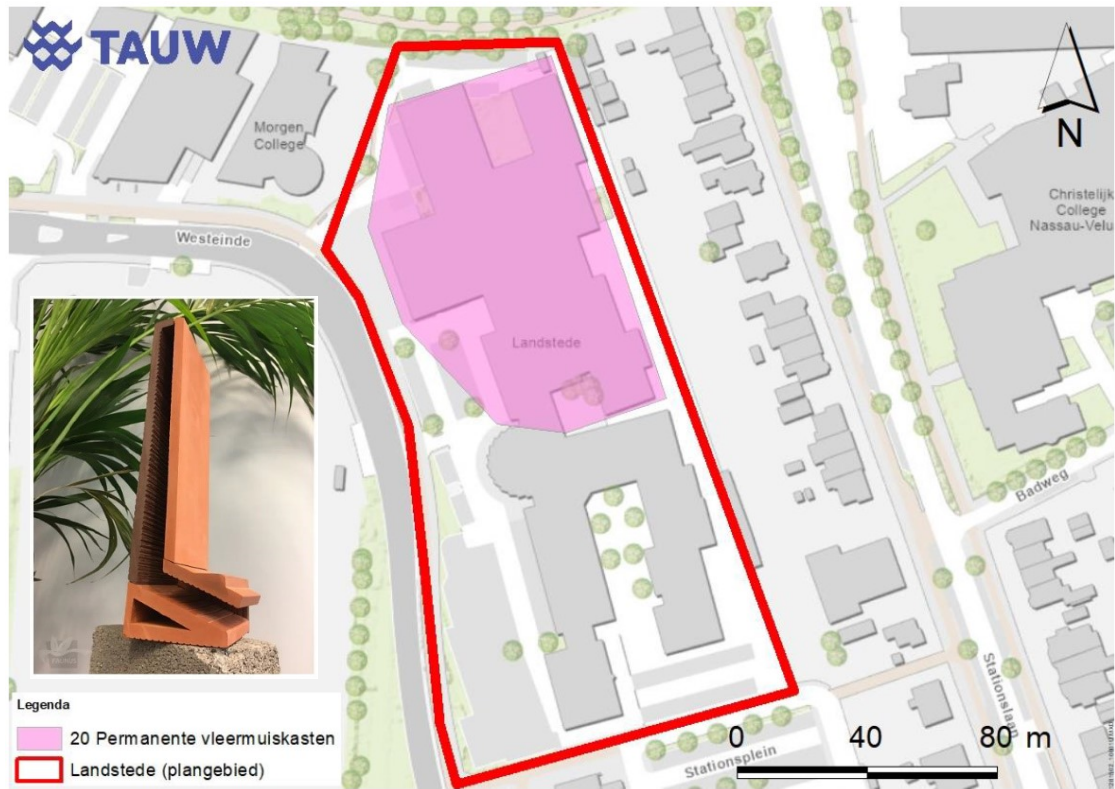
Figuur 4. Locatie van de nieuwbouw waarin 20 permanente inbouwkasten type Kleine tichelaar (inzet) of vergelijkbaar wordt gerealiseerd.