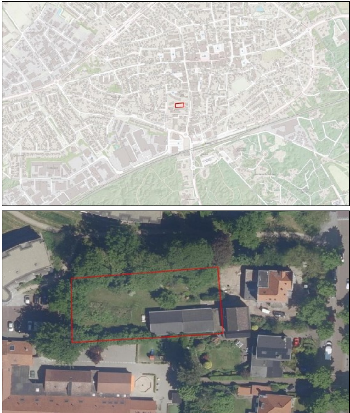
Figuur 1. De ligging en begrenzing van het plangebied aan de Stationstraat 36-38 te Nunspeet. Het plangebied met de te slopen schuur is rood omlijnd weergegeven.