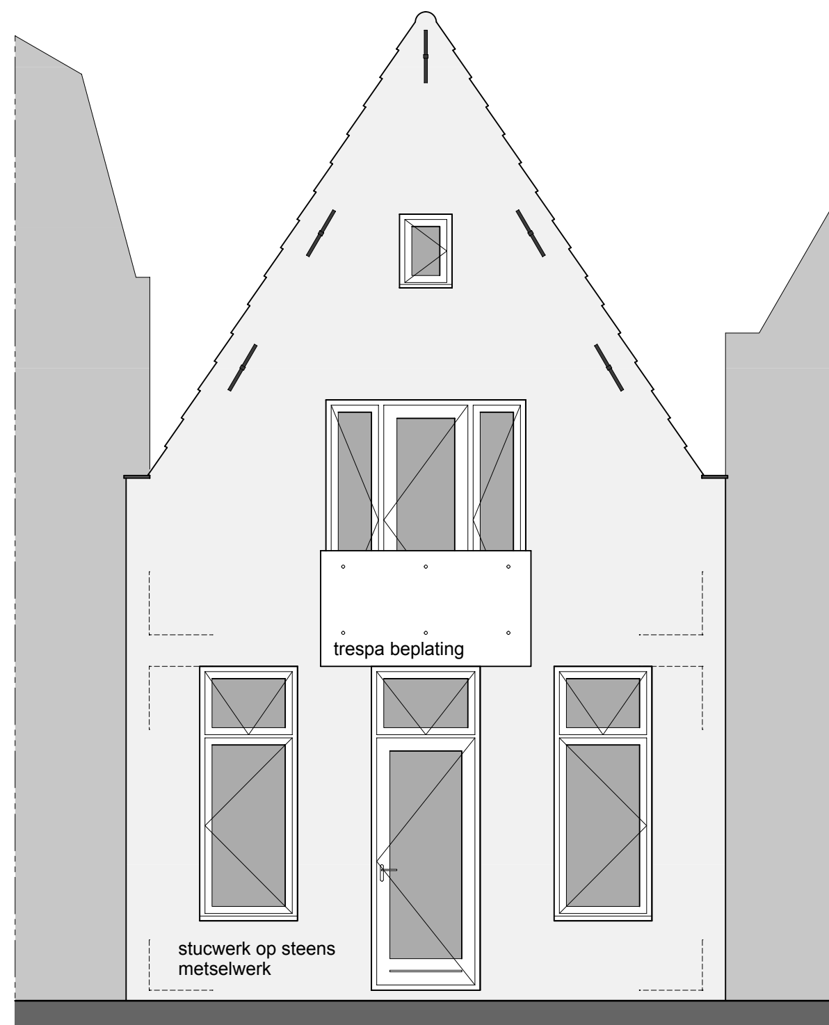
Achtergevel Bestaande situatie