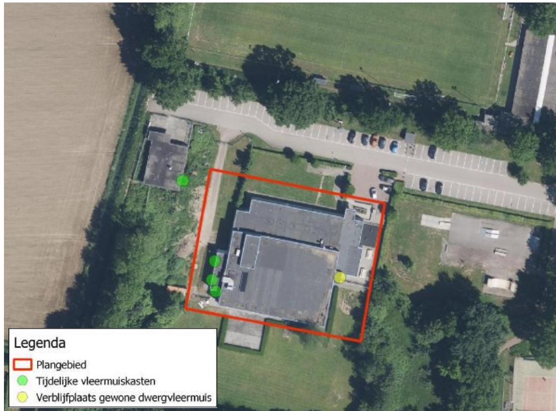
Figuur 3. Locaties tijdelijke vleermuiskasten ten opzichte van de huidige verblijfplaats van de gewone dwergvleermuis.