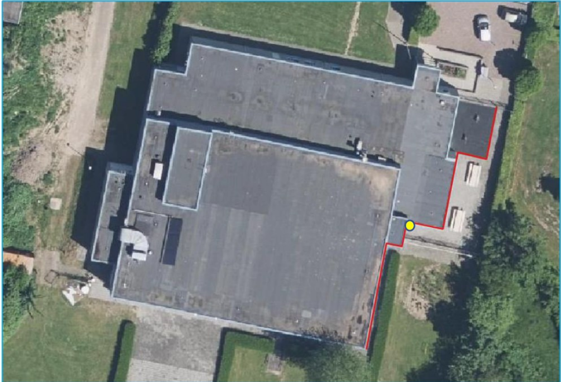
Figuur 2. Het ongeschikt maken van de te slopen bebouwing wordt uitgevoerd in twee fasen. In fase 1, voorafgaand aan de start van de nieuwbouw, wordt de oostzijde het oude zwembad ongeschikt gemaakt door het plaatsen van exclusion flaps.