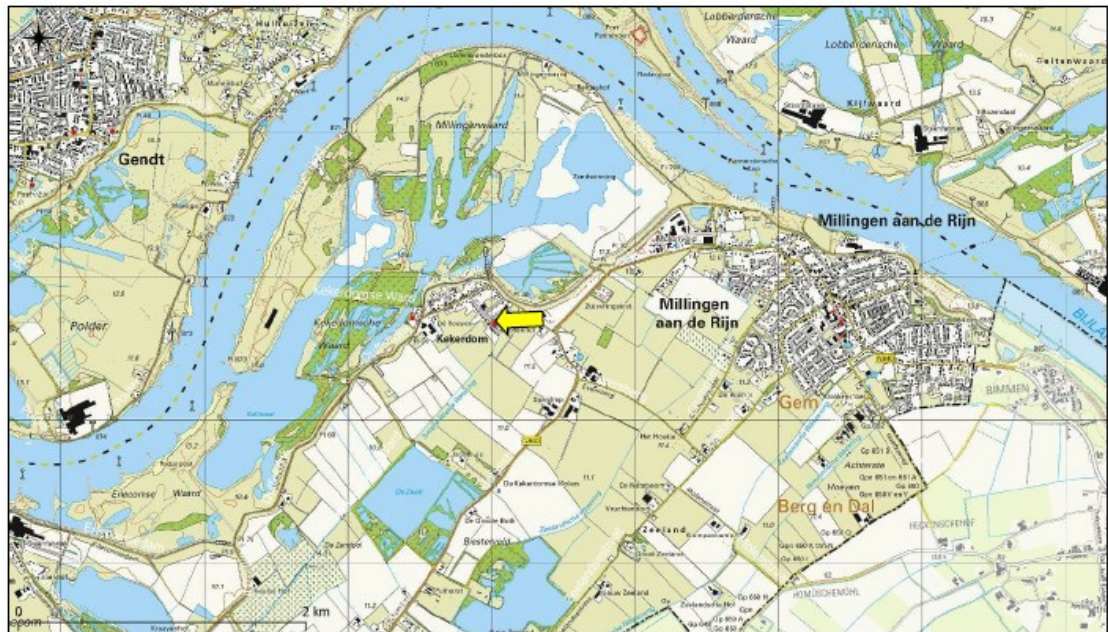
Figuur 1. Topografische ligging projectgebied.