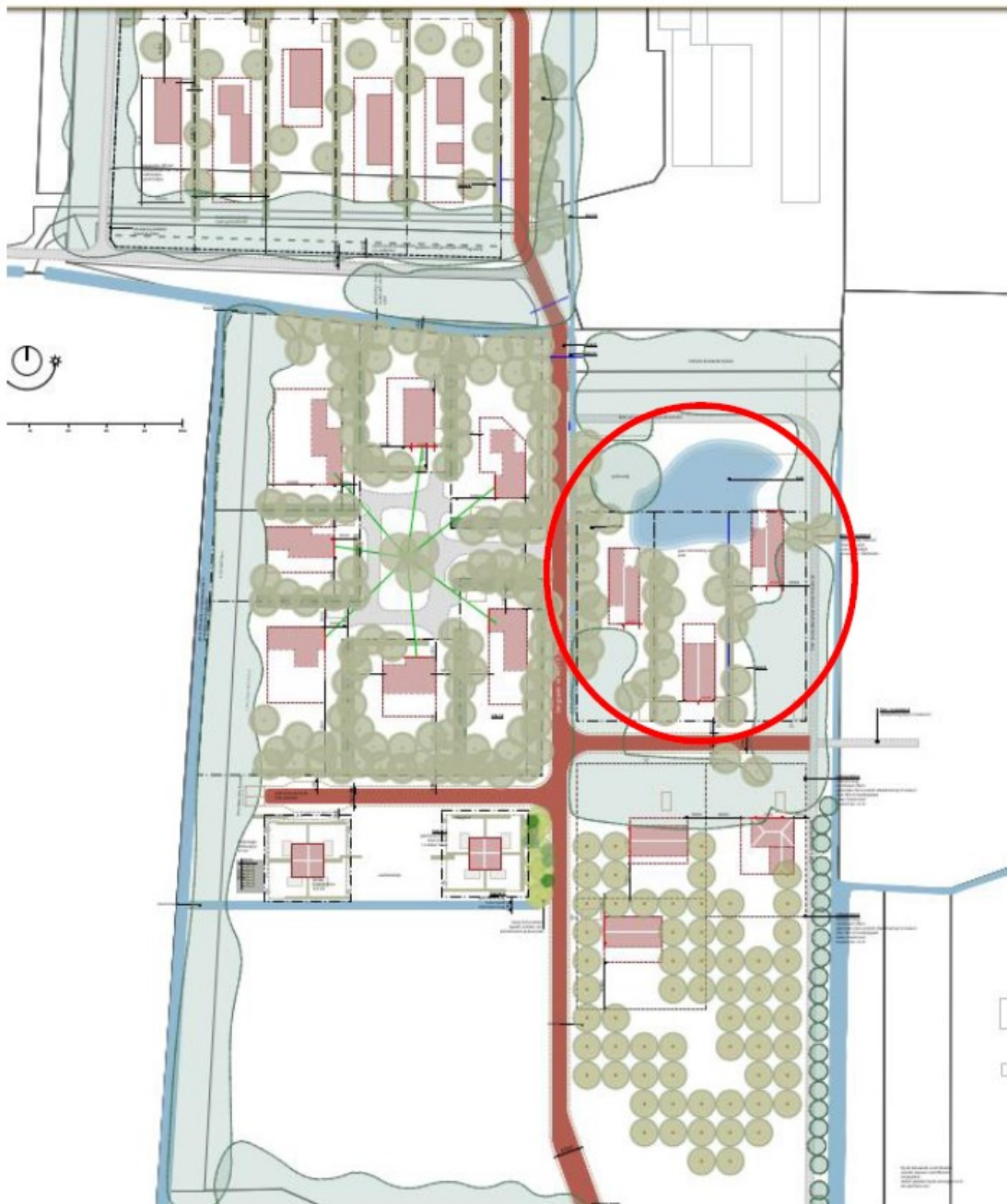
Figuur 4. Verbeelding toekomstige inrichting van het plangebied. Het leefgebied van de wezel is aangegeven met de rode cirkel.