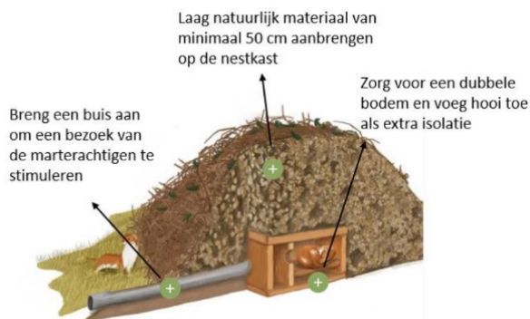
Figuur 3. Voorbeeld van de toe te passen marterkast voor de wezel. De diameter van de ingang en de grootte van de kast is belangrijk voor een succesvol gebruik: 2,5 cm voor de ingang en 4 cm voor de toegangsbuis; de dubbele bodemplaat heeft een afmeting van 21,5 x 12 cm.