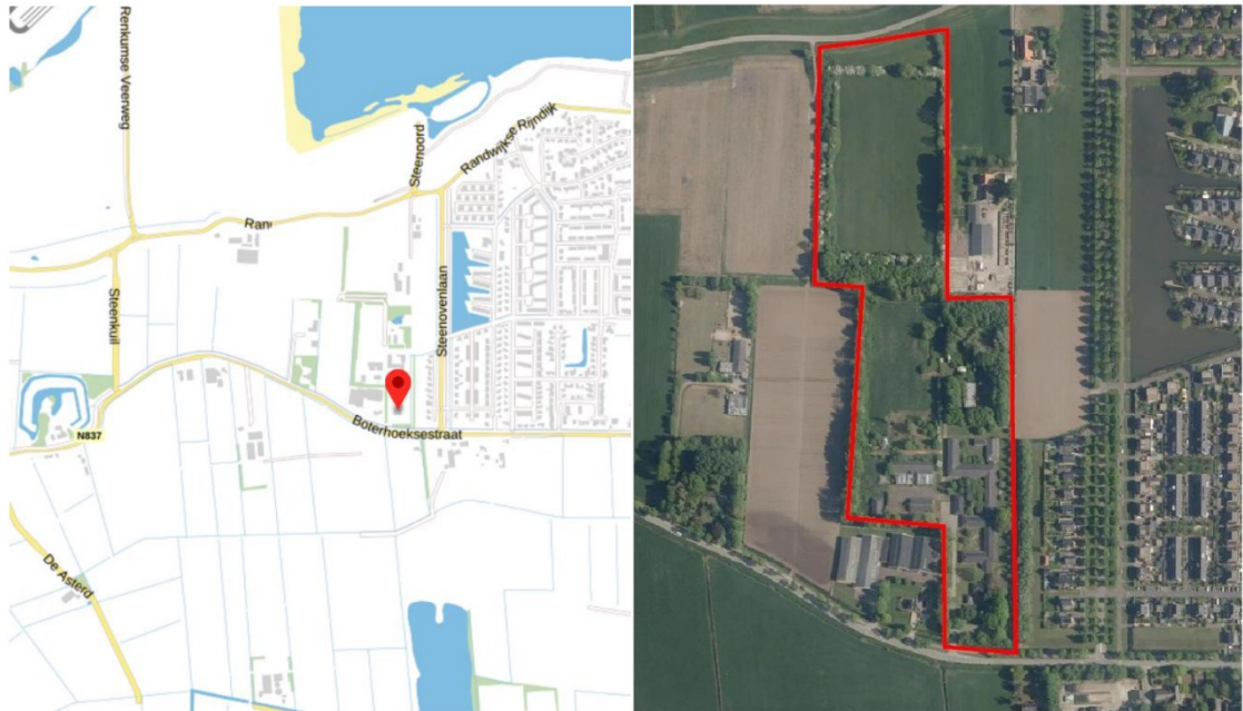
Figuur 1. Ligging en begrenzing projectgebied aan de Boterhoeksestraat 48 te Heteren.