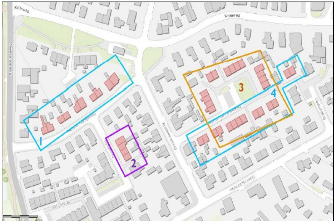
Figuur 1. De ligging en begrenzing van het plangebied aan de Meester Gangelweg 1 en omgeving, complex 1502 (1), 1503 (2), 1505 (3) en 1506 (4), te Hoenderloo. Het betreft in totaal 41 woningen, verdeeld over vier complexen/onderzoek clusters.