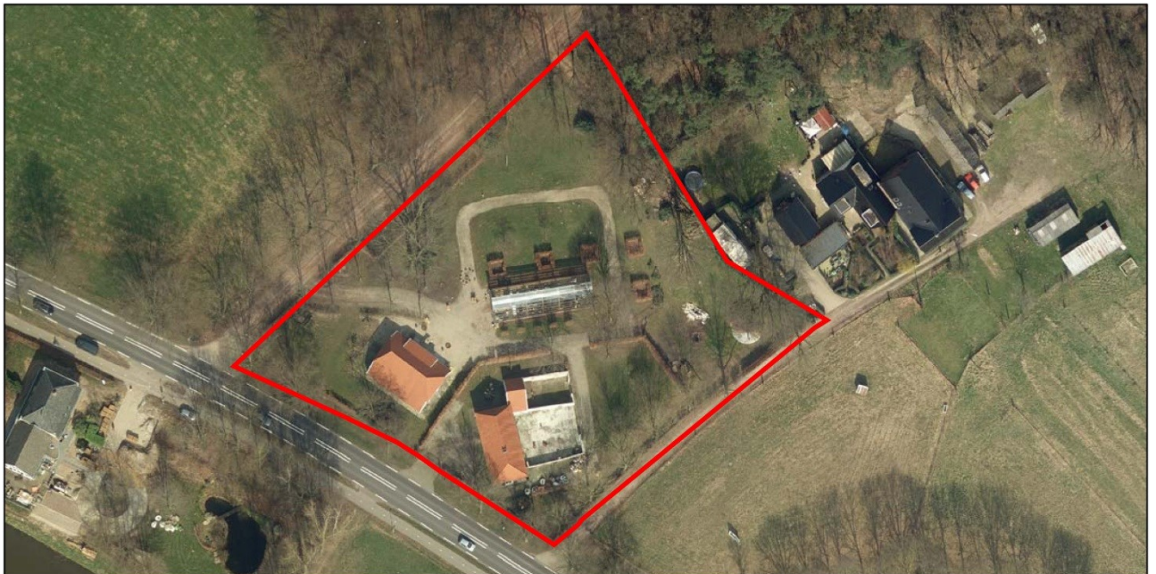
↑ Luchtfoto bestaande situatie plangebied.

Op het noordelijke deel van het plangebied is ruimte om een bouwperceel te creëren voor een nieuw te realiseren vrijstaande woning. De opbrengst van de verkoop van deze woning is noodzakelijk om de restauratie van de monumentale boerderij en van de historisch waardevolle schuur financieel haalbaar te maken. De woning komt aan de Bielheimerweg te liggen. De nog te ontwerpen woning komt op het noordoostelijke deel van het perceel waardoor de samenhang tussen de boerderij, de schuur en de kas niet wordt verstoord.