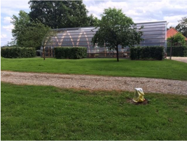
↑ Foto van de glazen kas.