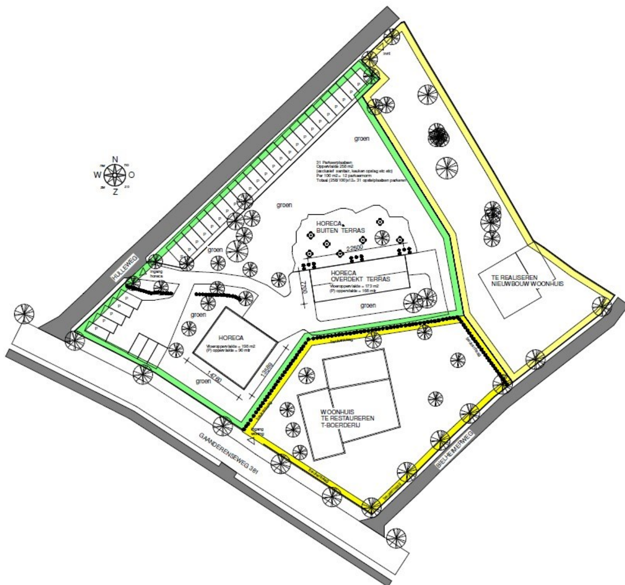
↑ Illustratie van de toekomstige inrichting van het plangebied. De locatie van de nieuwbouwwoning is indicatief.