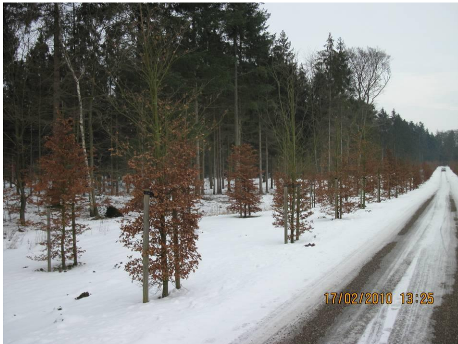
De pas aangeplante beuken langs de Hammerweg te Eerde leveren straks als volwassen bomen in belangrijke mate bij aan de kwaliteit van de lucht en de omgeving

Bomen hebben een positief effect op de luchtkwaliteit door de opname van koolstofdioxide en de productie van zuurstof. Steeds belangrijker wordt de rol van bomen bij de binding/absorptie van schadelijk fijnstof uit de lucht veroorzaakt door verkeer en industrie. Tot slot hebben bomen en groen in het algemeen een positief effect op het welbevinden en daarmee de gezondheid van de mens.