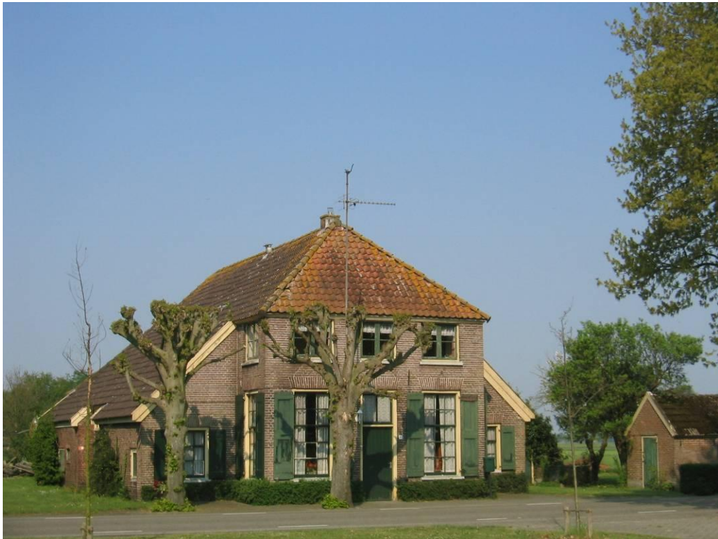
De oude leilinden geven deze boerderij aan de Balkerweg in Witharen een historisch karakter

Naast gebouwen zijn het de oude, monumentale bomen die bijdragen aan het historische karakter van Ommen. Bijvoorbeeld de oude leilinden aan de Balkerweg nummer 60 in Witharen. Ook kunnen dit gedenkbomen zijn, geplant ter herinnering aan een persoon of gebeurtenis. Bomen in parken kunnen herinneren aan een vroegere ontwerpstyl of specifieke architect. Kortom, bomen houden de geschiedenis levend.