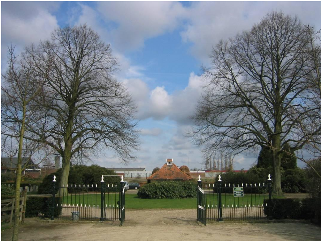
Het duo lindebomen op de begraafplaats aan de Hardenbergerweg markeren een belangrijke locatie

Ze vormen belangrijke markerings- en oriëntatiepunten en begeleiden bezoekers in en uit de kern. Bomen hebben een verzachtend effect op de 'harde' stenen omgeving. Bomen geven betekenis en karakter aan pleinen en andere belangrijke plekken, markeren begrenzingsen en maskeren ontsierende elementen.