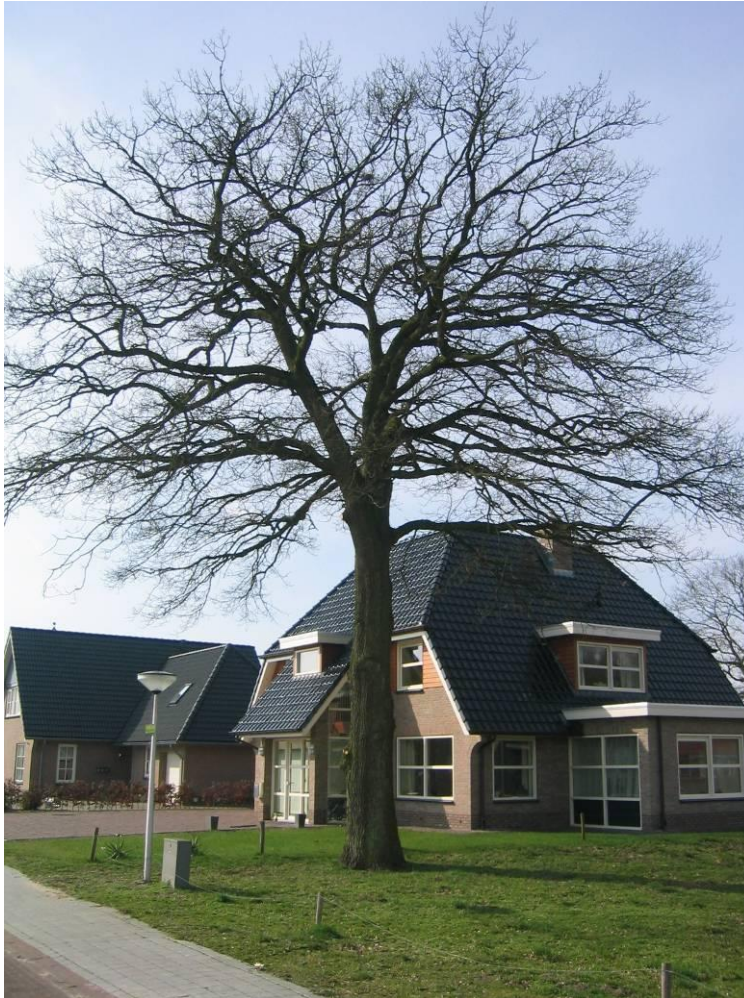
De eik aan de Willem van de Veldestraat in Alteveer is op een juiste wijze ingepast in de nieuwe situatie

Meerdere malen is door de klankbordgroep dit onderwerp aan de kaak gesteld. De meeste 'bomenkwesties' betreffen nieuwbouwprojecten, reconstructies en ruimtelijke ontwikkelingen die conflicteren met bestaande bomen. Meer dan eens komen bomen pas in een laat stadium (laat in de ontwerpfase of zelfs pas bij uitvoering) in beeld. Omdat dan beslissingen genomen dienen te worden over kap/behoud is deze problematiek vervlochten met het kapbeleid. In het nieuwe plan zal integraal beleid voor boombescherming worden gemaakt met speciale aandacht voor dit onderwerp.