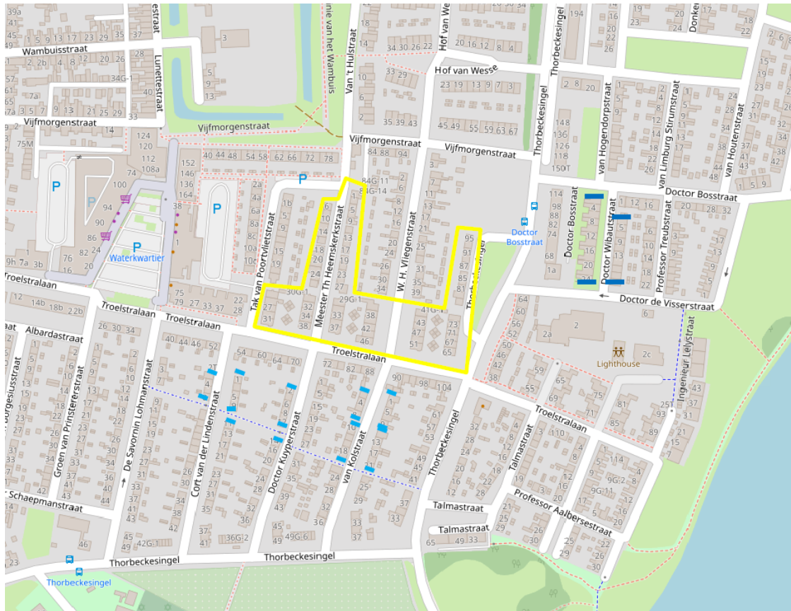
Figuur 4: Locaties 40 tijdelijke vleermuiskasten (Foreest Groen Consult B.V., 2021)