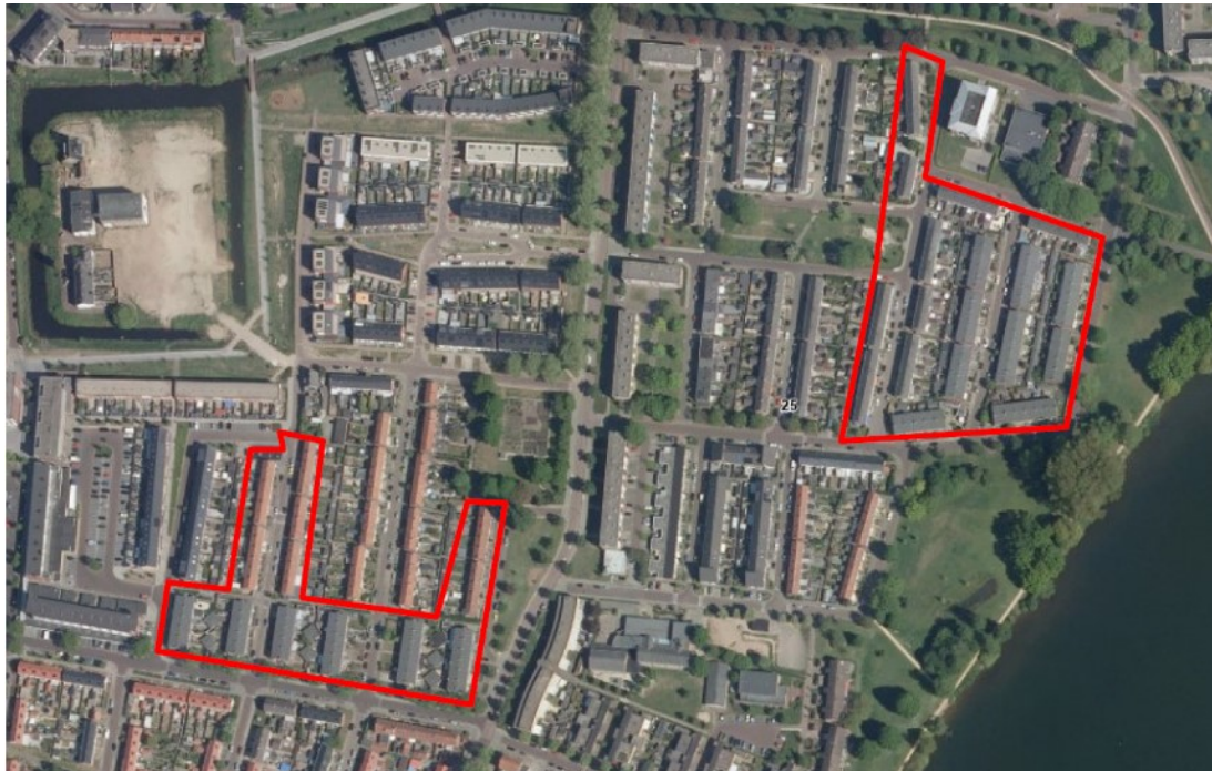
Figuur 1: Plangebied binnen rode kaders (Foreest Groen Consult B.V., 2021)