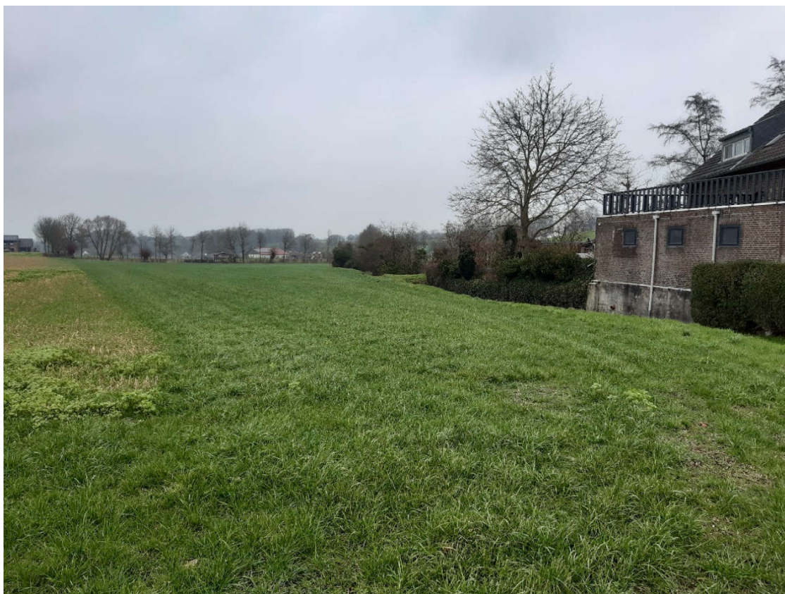
Figuur 2: Bestaande situatie nieuwe waterberging