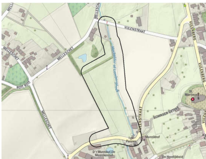
Figuur 1 Ligging plangebied met Mechelderbeek en aanliggend graslandperceel t.b.v. regenwaterbuffer Vijenstraat.