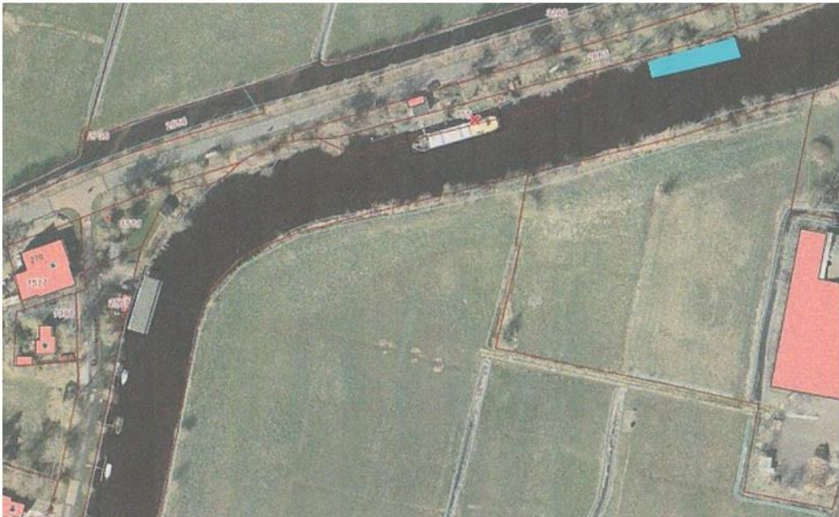
Figuur 1: In het blauw de beoogde ligplaats voor een woonschip

De locaties waarvoor vergunning wordt gevraagd liggen in en langs de Gave tussen Hoofdstraat 270A en 270B te Oostwold, zoals hieronder is weergegeven in figuur 1 en 2.