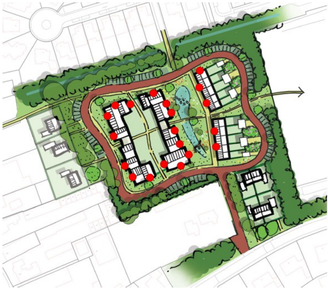
Figuur 4. Voorstel locaties van de twintig permanente verblijfplaatsen (rode stippen) in het schetsontwerp van de toekomstige situatie.