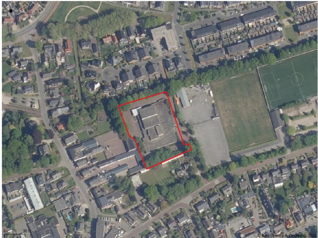
Figuur 1. Ligging en begrenzing projectgebied Roelenengweg 25 te Voorthuizen.