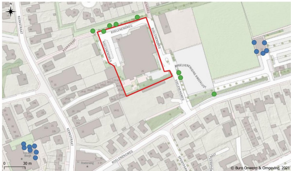
Figuur 3. Tijdelijke mitigatie in de vorm van 20 vleermuiskasten (type VK WS 02) aan gebouwen (blauwe stippen) en bomen (groene stippen) ten opzichte van het projectgebied (rode kader). De kasten zijn opgehangen op 26 januari 2022.