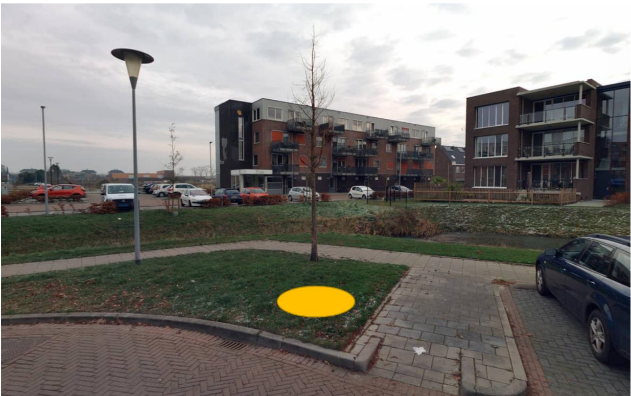
Figuur 2: Omgeving beoogde containerlocatie