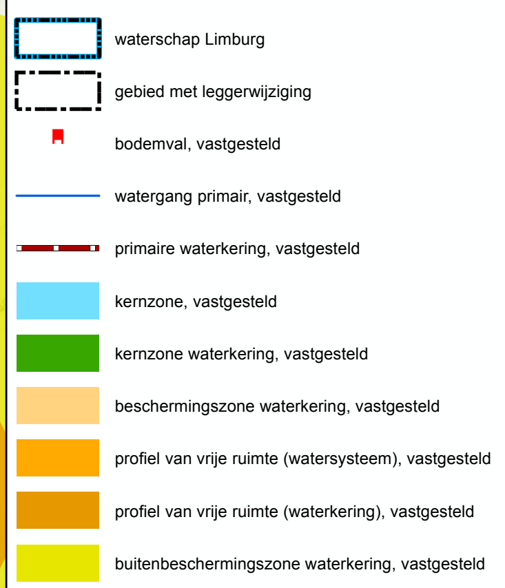
Overzichtskaartje (schaal 1:650.000)