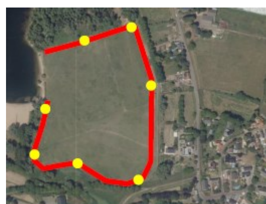
Figuur 5 Geschikte locaties (geel) en zoekgebied (rood) voor alternatieve verblijfplaatsen