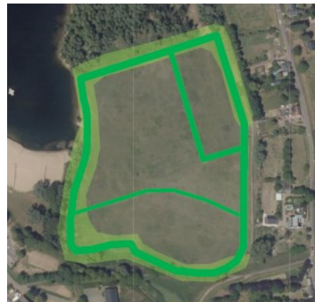
Figuur 4 Geschikt foerageergebied/migratieroutes voor kleine marterachtigen (groen)