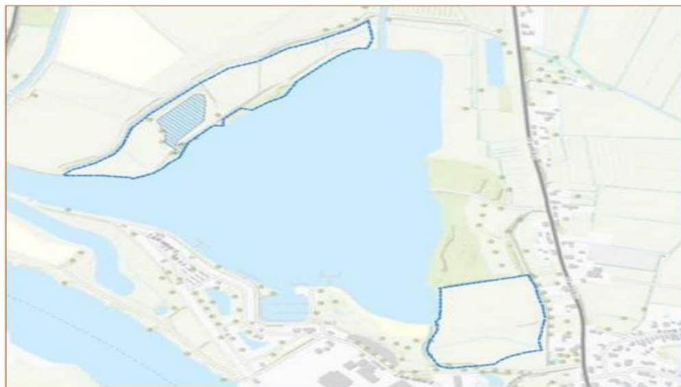
Figuur 2 Het plangebied bestaat uit de 2 blauw omlijnde gebieden die liggen binnen het natuur- en recreatiegebied De Neswaarden, gemeente Aalst