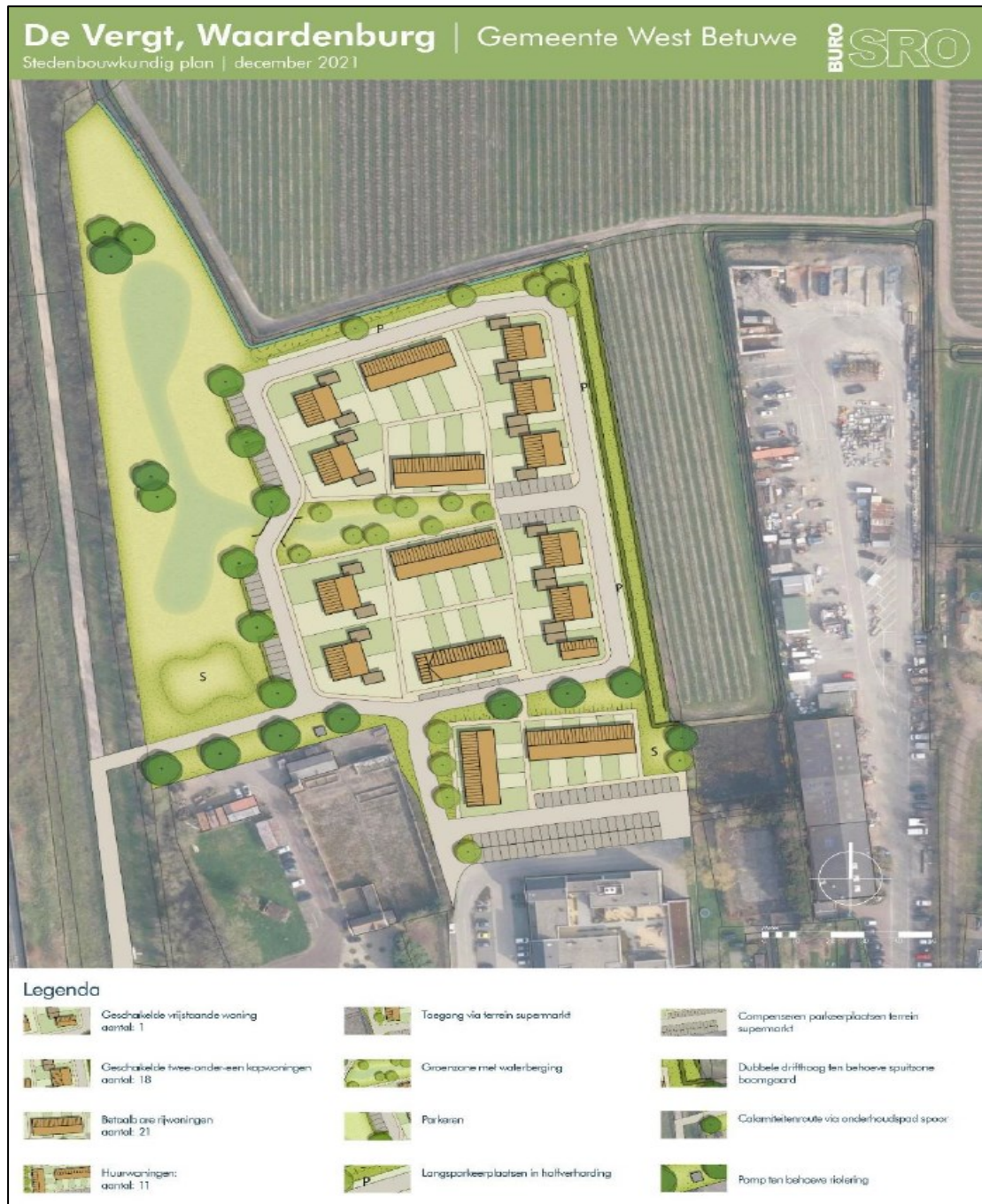
Figuur 3. Een overzicht van de nieuwe situatie met 51 nieuwe woningen en 124 parkeerplaatsen. De grootte van de nieuwe groenzone inclusief aan te leggen wadi bedraagt in de nieuwe situatie 10.393 m 2 .