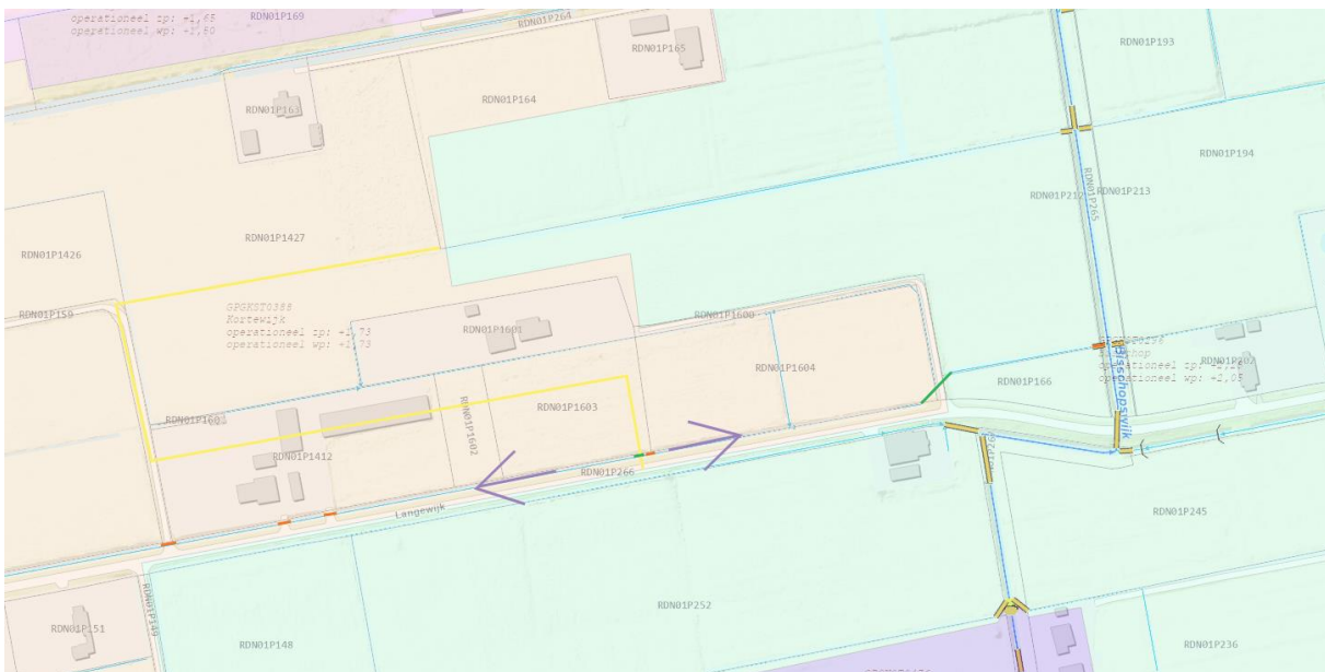
Figuur 1: Locatie van werkzaamheden. Rode lijnen: bestaande dammen met duiker. Groene lijnen: nieuwe duikers. Paarse lijnen: stroomrichting in nieuwe situatie. Gele lijn: nieuwe peilgrens.

Het dagelijks bestuur van het waterschap Noorderzijlvest heeft op 21 februari 2022 van namens _____ een aanvraag ontvangen om een vergunning als bedoeld in hoofdstuk 6 van de Waterwet (Wtw). De aanvraag betreft het aanleggen van een dam met duiker nabij Langewijk te Nieuw-Roden, zoals hieronder globaal is weergegeven in figuur 1.