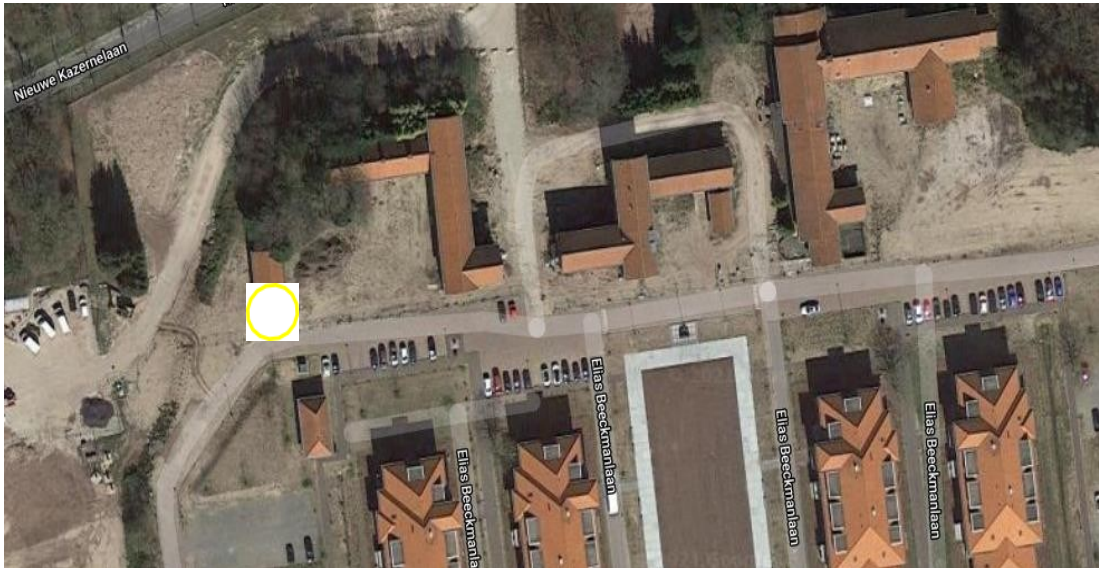
Figuur 4: Verblijfplaats van de steenmarter onder dakpannen. Met de gele cirkel wordt de verblijfplaats aangeduid. In de groene cirkel werd tweemaal een uit het gebouw afkomstige steenmarter waargenomen, incl. looprichting (witte pijl).