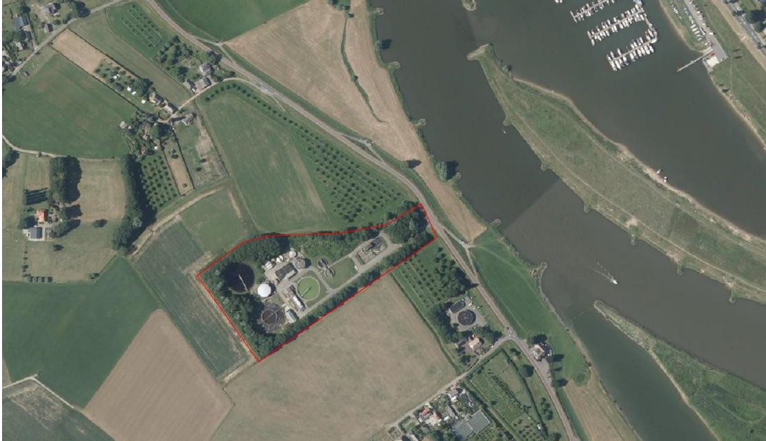
Figuur 1: Ligging plangebied binnen rode kader (Reijngoudt, 2020)