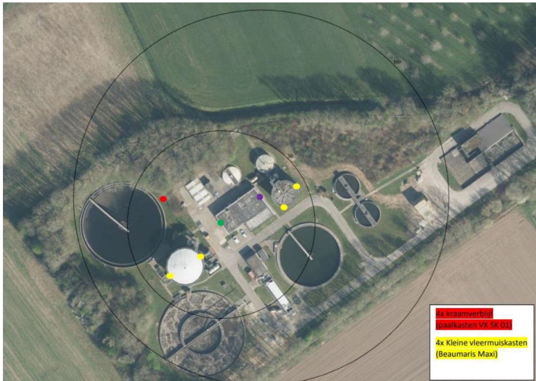
Figuur 2: Mitigerende maatregelen. In rood de locaties van de paalkasten en in geel de vleermuiskasten type Beaumaris maxi. Met groen en paars worden de oorspronkelijke verblijfplaatsen weergegeven (Van Os, V.A., 2022)