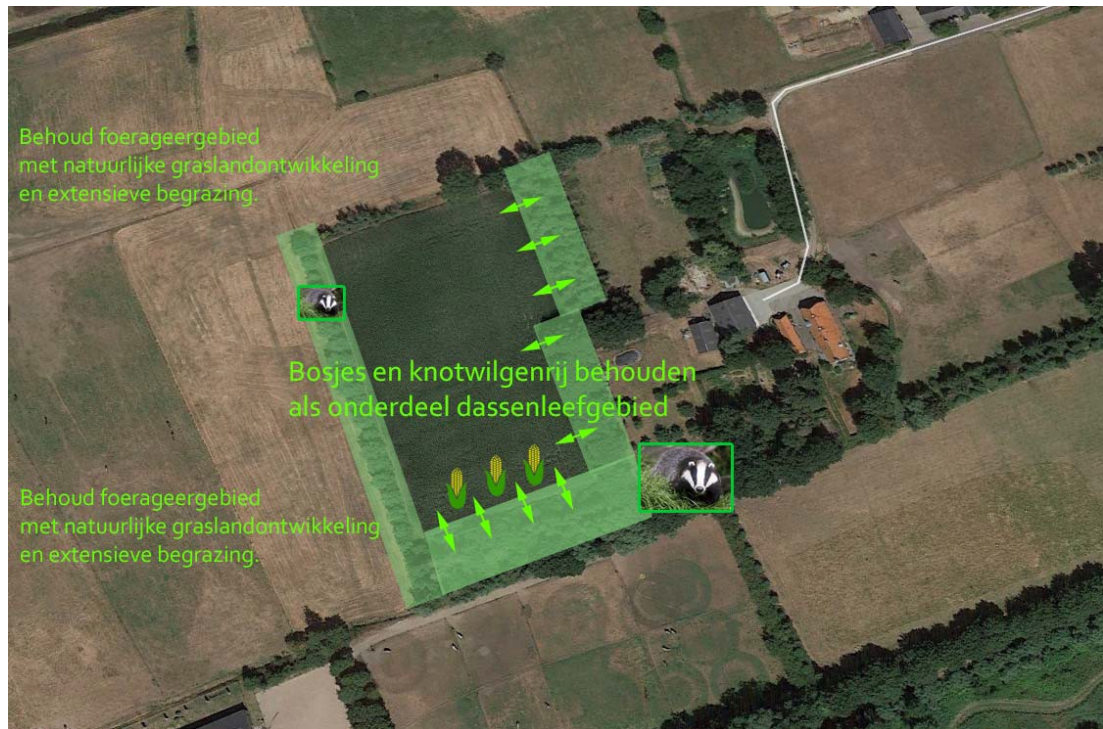
Figuur 4: Locaties van de mitigerende maatregelen op het voormalige maisperceel aan de zuidostrand van het plangebied. Dit perceel van ongeveer 1 ha wordt omgevormd tot optimaal foerageergebied.