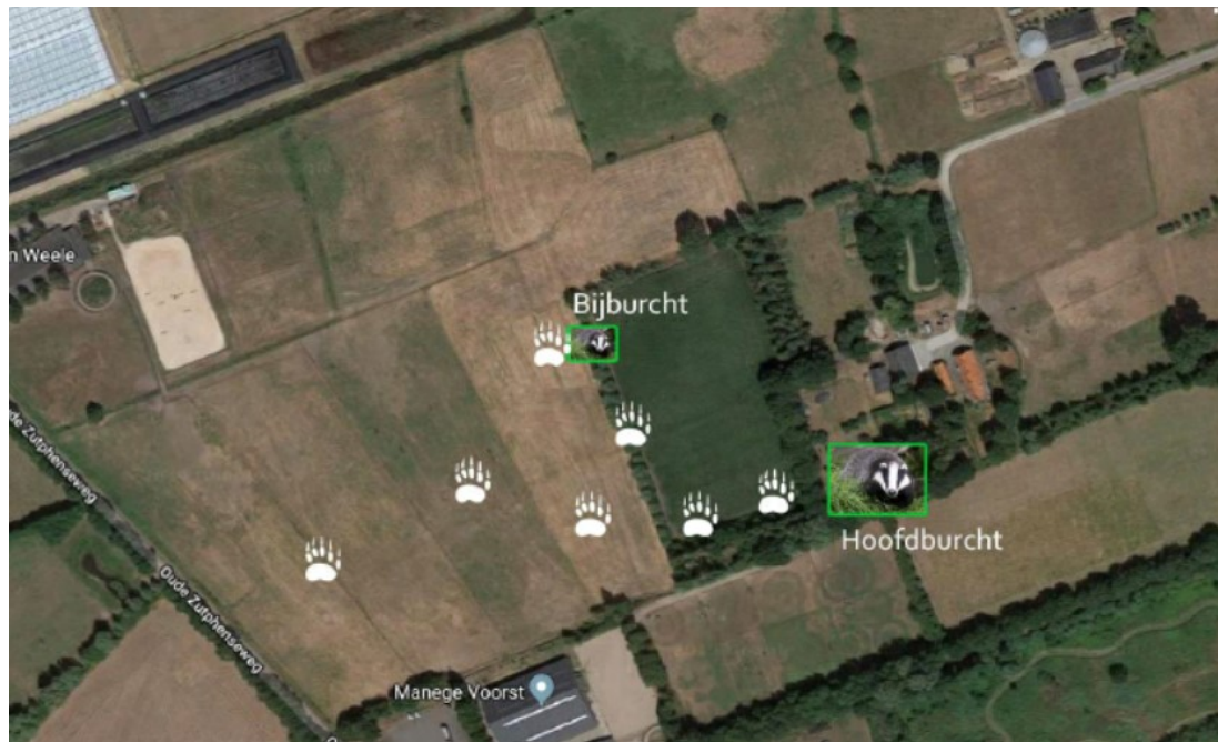
Figuur 2: Ligging van de hoofd- en bijburcht ten zuidoosten van het plangebied en dassensporen in de buurt van de burchten. De bijburcht is de laatste jaren niet meer in gebruik.