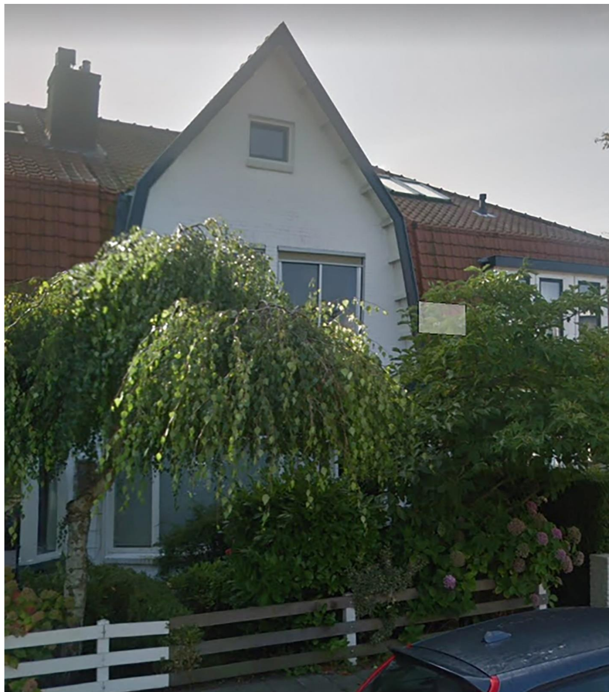
Afbeelding van Spaargarenstraat 4 (2022)

AANVRAAG: omgevingsvergunning voor het realiseren van een fietsenstalling in de voortuin op het adres Spaargarenstraat 4 in Oegstgeest