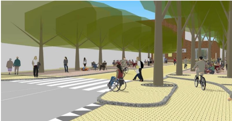
Figuur 3 Impressie toekomstbeeld - Stationsstraat - Gedempte Zuiderdiep