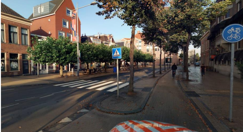
Figuur 2 Huidige situatie - Stationsstraat - Gedempte Zuiderdiep