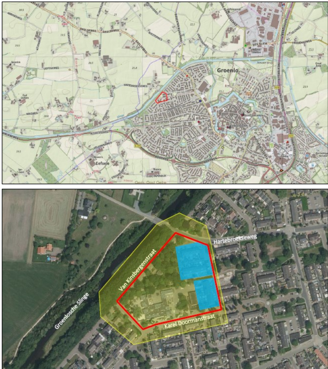
Figuur 1. De ligging en begrenzing van het plangebied aan de Karel Doormanstraat 66 te Groenlo (rood omlijnd). Op de onderste afbeelding is het onderzoeksgebied geel gemarkeerd, terwijl de te behouden woonhuizen aan de Hartebroekseweg binnen het plangebied blauw gemarkeerd zijn. Het plangebied is rood omlijnd.