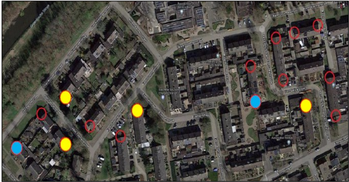
Figuur 2. De locaties van de tijdelijke vleermuiskasten van het type Beaumaris Maxi van Vivara Pro. Op de geel gearceerde locaties is 1 kast opgehangen. Op de blauw gearceerde locaties zijn 2 kasten opgehangen. De lege rood omcirkelde locaties weergeven potentiële geschikte locaties.