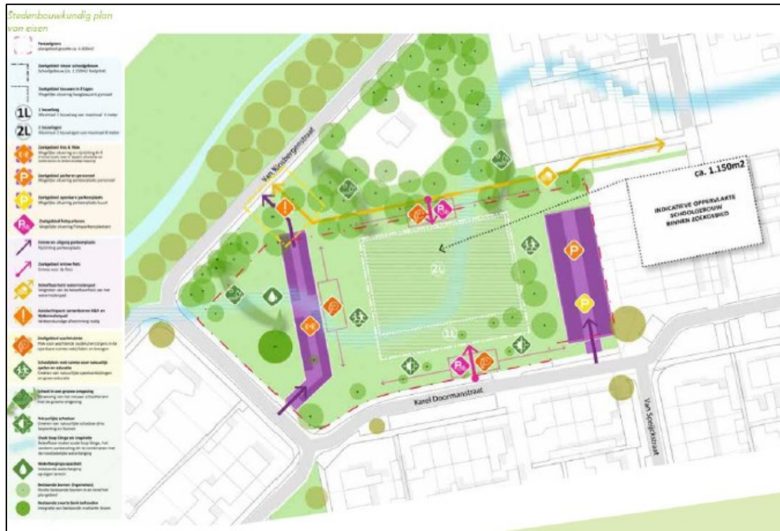
Figuur 3. Een schetsontwerp van het plangebied in de nieuwe situatie. De oppervlakte van het schoolgebouw zal circa 1.150 m 2 groot zijn. Ten westen van het plangebied komt een Kiss&Ride. Aan de oostzijde is een parkeerplaats gesitueerd.