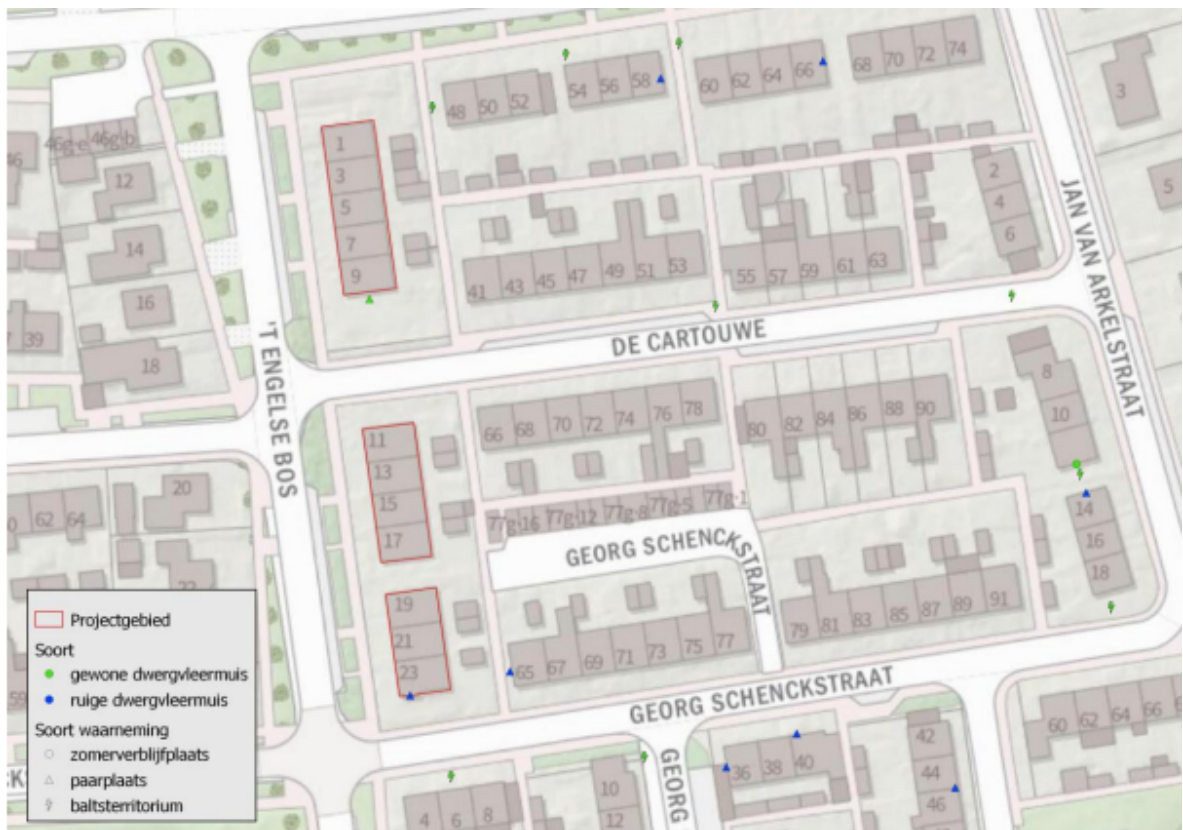
Figuur 2; Waarnemingen vleermuizen binnen en in de omgeving van het projectgebied.