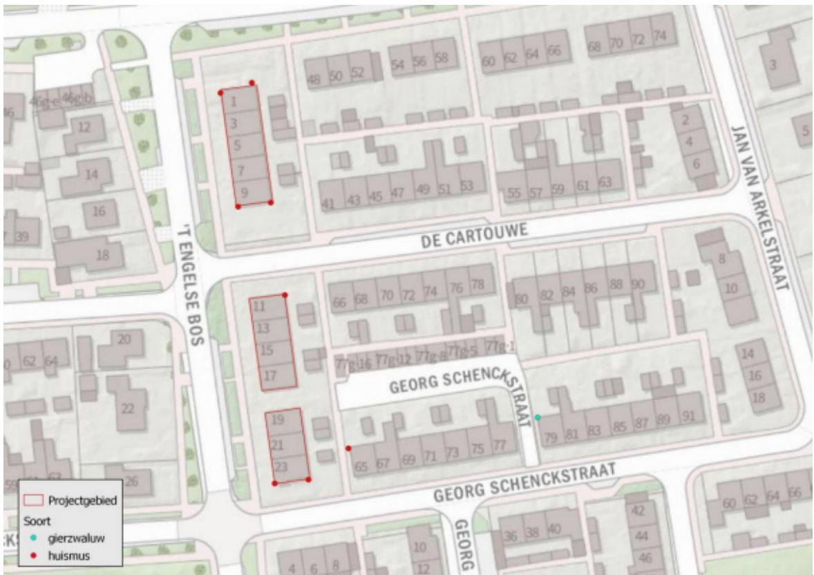
Figuur 3; Waarnemingen vogels binnen en in de omgeving van het projectgebied.