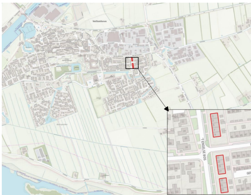
Figuur 1; Ligging van het projectgebied (rood omlijnd) in Vollenhove

Wetland Wonen is van plan om vanaf 15 september 2022 tot december 2022 renovatie werkzaamheden uit te voeren aan twaalf rijtjeswoningen, verdeeld in drie blokken, in Vollenhove. Buitenpandige werkzaamheden bestaan uit na-isolatie van de spouwmuur bij kopgevels en lengtegevels, gaten bij de bouwmuur herstellen, het vervangen van ramen door isolerend glas, het plaatsen van zonnepanelen, het vervangen van gebroken dakpannen, het plaatsen van nieuwe schoorstenen, diverse schilderwerkzaamheden, het herstellen van voegwerk en plaatsen van steigers voor uitvoering van deze werkzaamheden. Omringende tuinen en gemeentegroen blijven onveranderd.