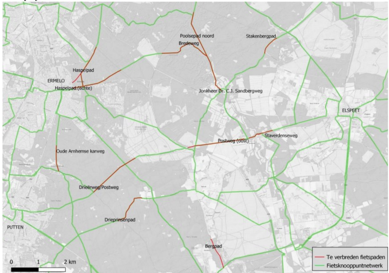
Figuur 1 Te verbreden en vernieuwen fietspaden binnen de gemeente Ermelo.