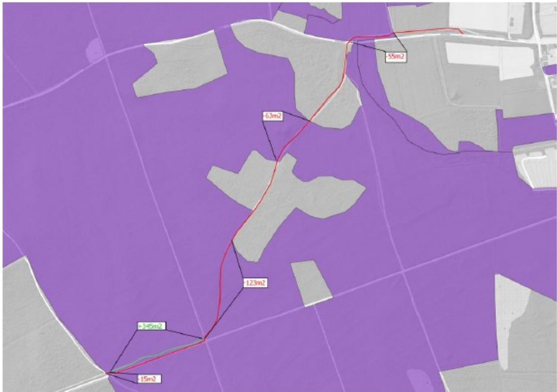
Figuur 4 Het te verbreden fietspad aan het Drieprinsenpad (rode lijn), het fietspadtracé dat wordt opgeheven (groene lijn) en de ligging van H9120 Beuken-eikenbos met hulst (paars).