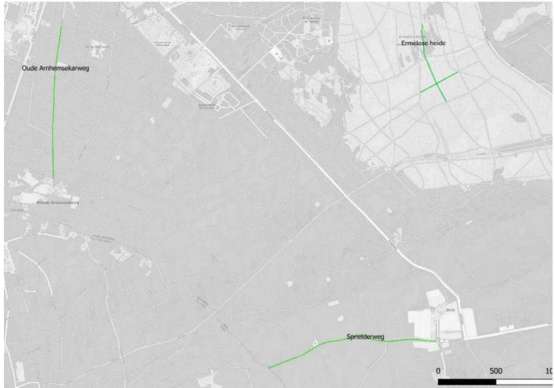
Figuur 5 Af te sluiten wegen voor gemotoriseerd verkeer (Oude Arnhemsekarweg en Sprielderweg) en af te sluiten zandpaden voor recreatie op de Ermelose heide.