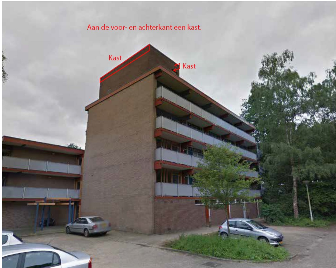
Figuur 3: Locaties permanente voorzieningen laatvlieger op de opbouw binnen het plangebied (Slemmer, 2022)