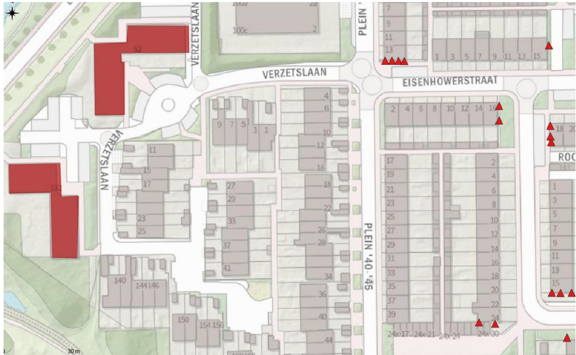
Figuur 2: locaties van de tijdelijke vleermuiskasten aangegeven met rode driehoeken (Slemmer, 2021)