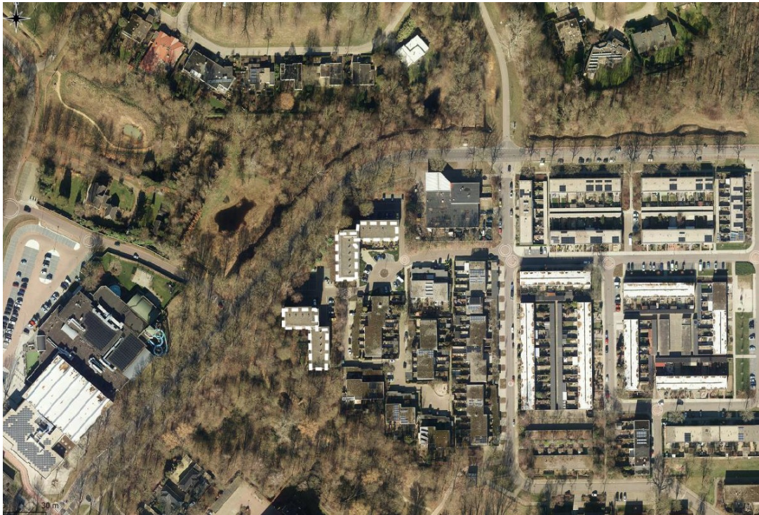
Figuur 1: Plangebied binnen witte kaders (Slemmer, 2021)