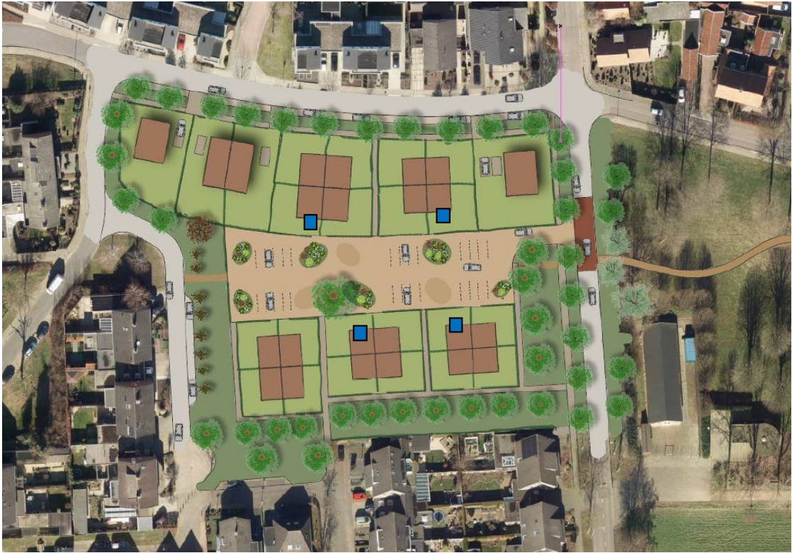
Figuur 3: locaties permanente voorzieningen in de nieuwbouw aangegeven met blauwe vierkanten (Slemmer, 2021)