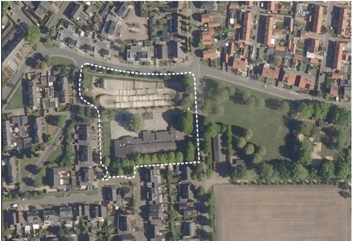
Figuur 1: Plangebied binnen witte stippellijn (Slemmer, 2021)