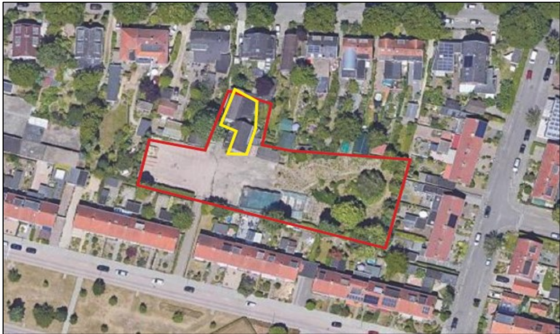
Figuur 1. Ligging en begrenzing van het plangebied aan de Heiweg 235A te Nijmegen. Op de onderste afbeelding is de te slopen woning met aanliggende schuur geel gemarkeerd. Het gehele plangebied, inclusief een groot deel verharding en enkele oude kassen, is rood gemarkeerd.