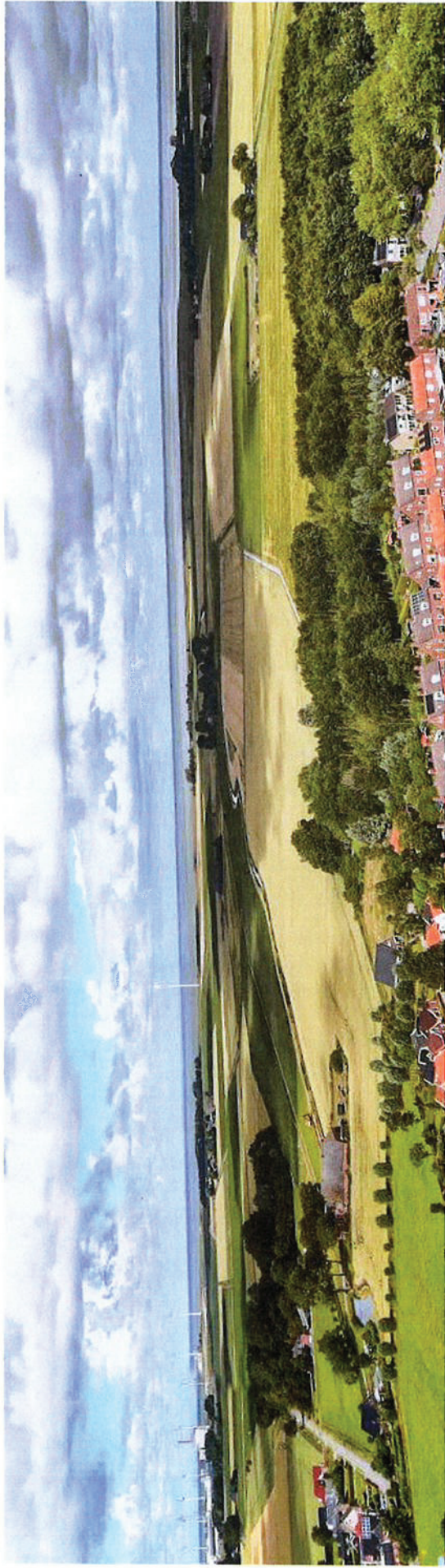
Afbeelding 18. Zicht vanuit het dorp Spijk richting het oosten, de Spijksterriet volgend