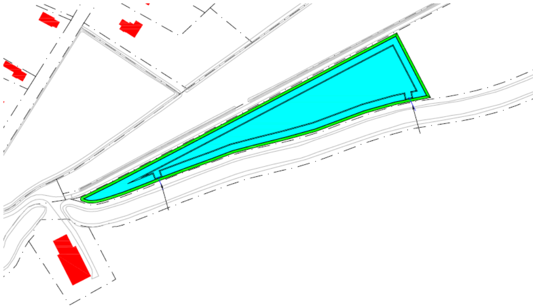
Figuur 1: locatie van de werkzaamheden.

Het dagelijks bestuur van het waterschap Noorderzijlvest heeft op 24 augustus 2021 van [REDACTED] [REDACTED] Bedum namens Waddenwind B.V., [REDACTED] Marum een aanvraag ontvangen om een vergunning als bedoeld in hoofdstuk 6 van de Waterwet (Wtw). De aanvraag betreft het graven van een waterpartij en aanleggen van duikers op het perceel kadastraal bekend als gemeente Bierum, sectie M, perceelnummer 460 te Spijk, zoals hieronder globaal is weergegeven in figuur 1.