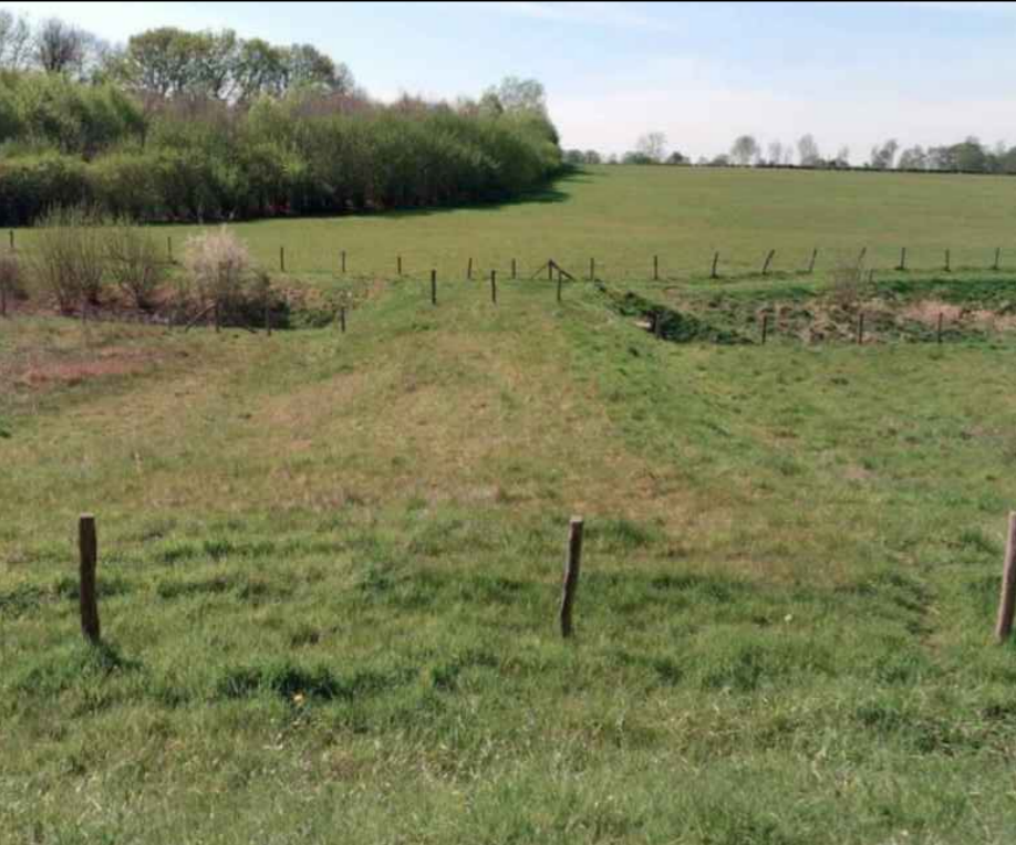
Bestaande nooddam welke wordt opgehoogd