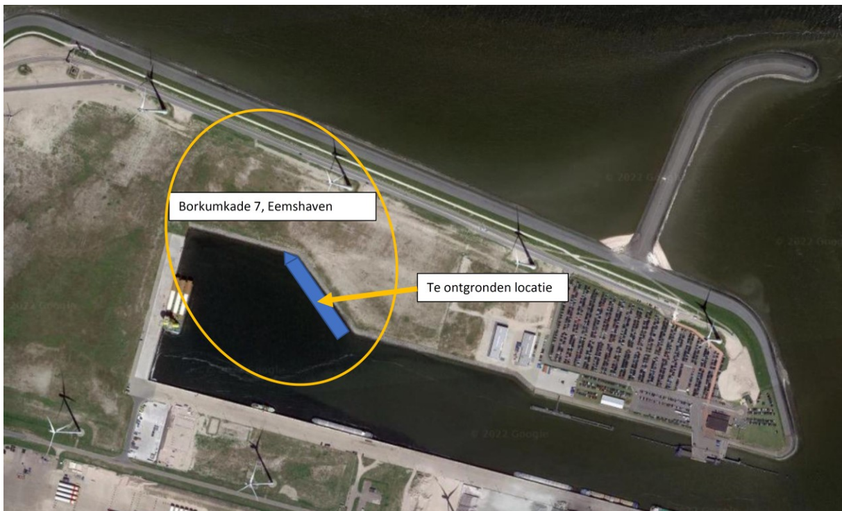
Figuur 1: Situering van de bij de ontgroning betrokken percelen (ter plaatse van het blauwe vlak)

De ontgroning (het verwijderen van een deel van de waterbodem) dient plaats te vinden binnen de betreffende kadastrale percelen conform de situatietekeningen in bijlage 5 van dit besluit. De ligging van de betrokken percelen is aangegeven in figuur 1.