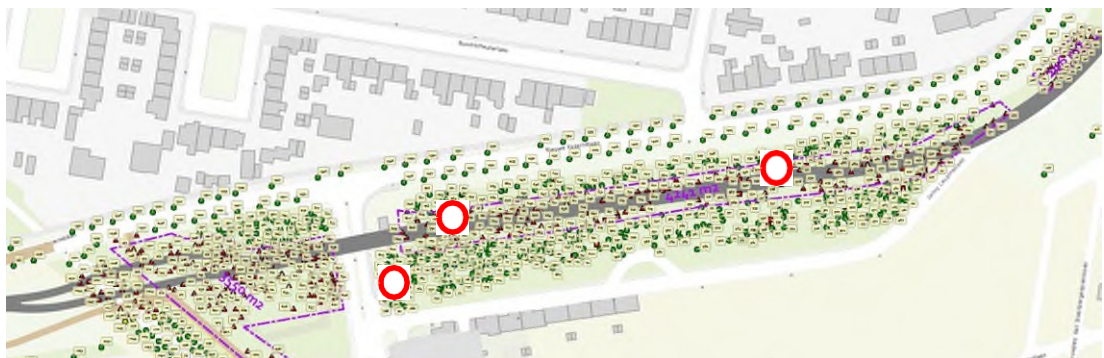
Figuur 3. Plantekening Parklaan, bomenkap en eekhoornnesten