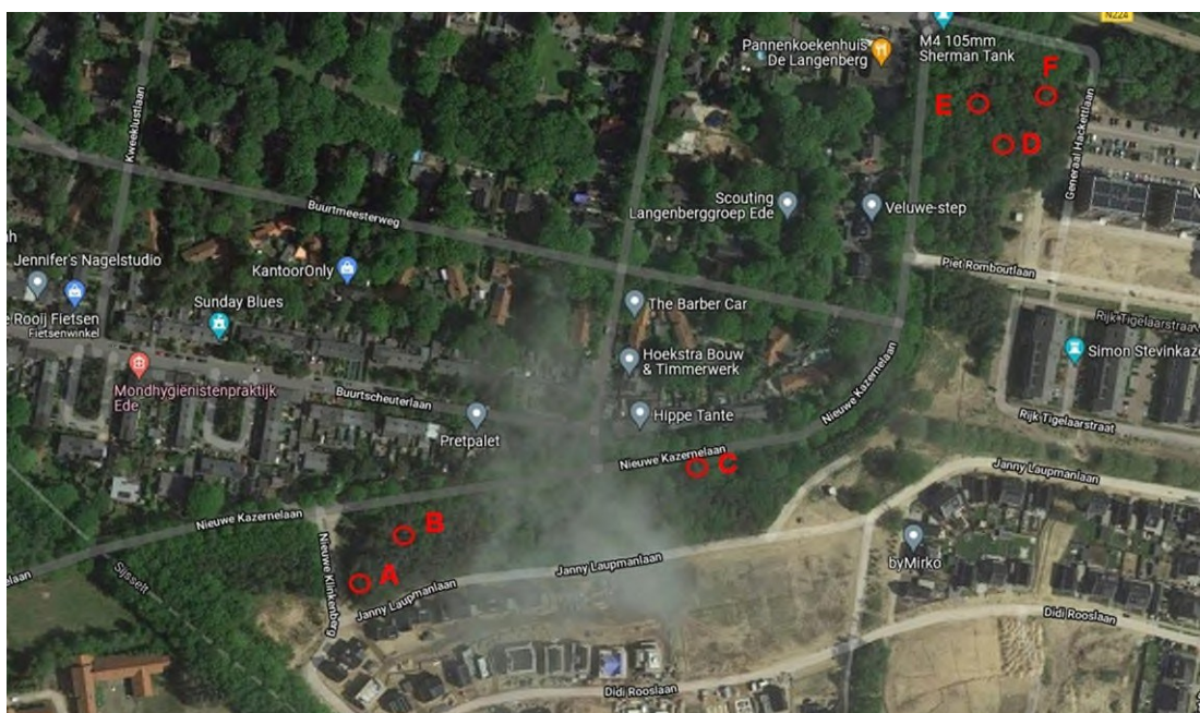
Figuur 1. Eekhoornnesten (kraam/winternesten), aangetroffen op 11-2-2022.

Door Laneco is op 11-2-2022 een onderzoek uitgevoerd naar eekhoornnesten in te kappen bosstroken langs de Nieuwe Kazernelaan in Ede. Er zijn zes eekhoornnesten aangetroffen. De resultaten zijn weergegeven in figuur 1.