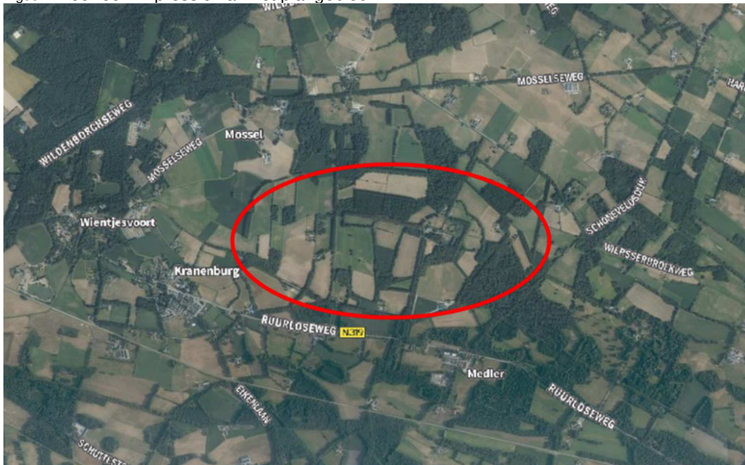
Figuur 1 Ligging plangebied

Landgoed 't Medler is een historische buitenplaats van 300 hectare omvang met tuin, bos, natuur en landbouwgrond, rondom de hoofdloop van de Baakse Beek. Het landgoed heeft hoge cultuurhistorische en ecologische waarden. Zie Figuur 2 voor een impressie van het plangebied.