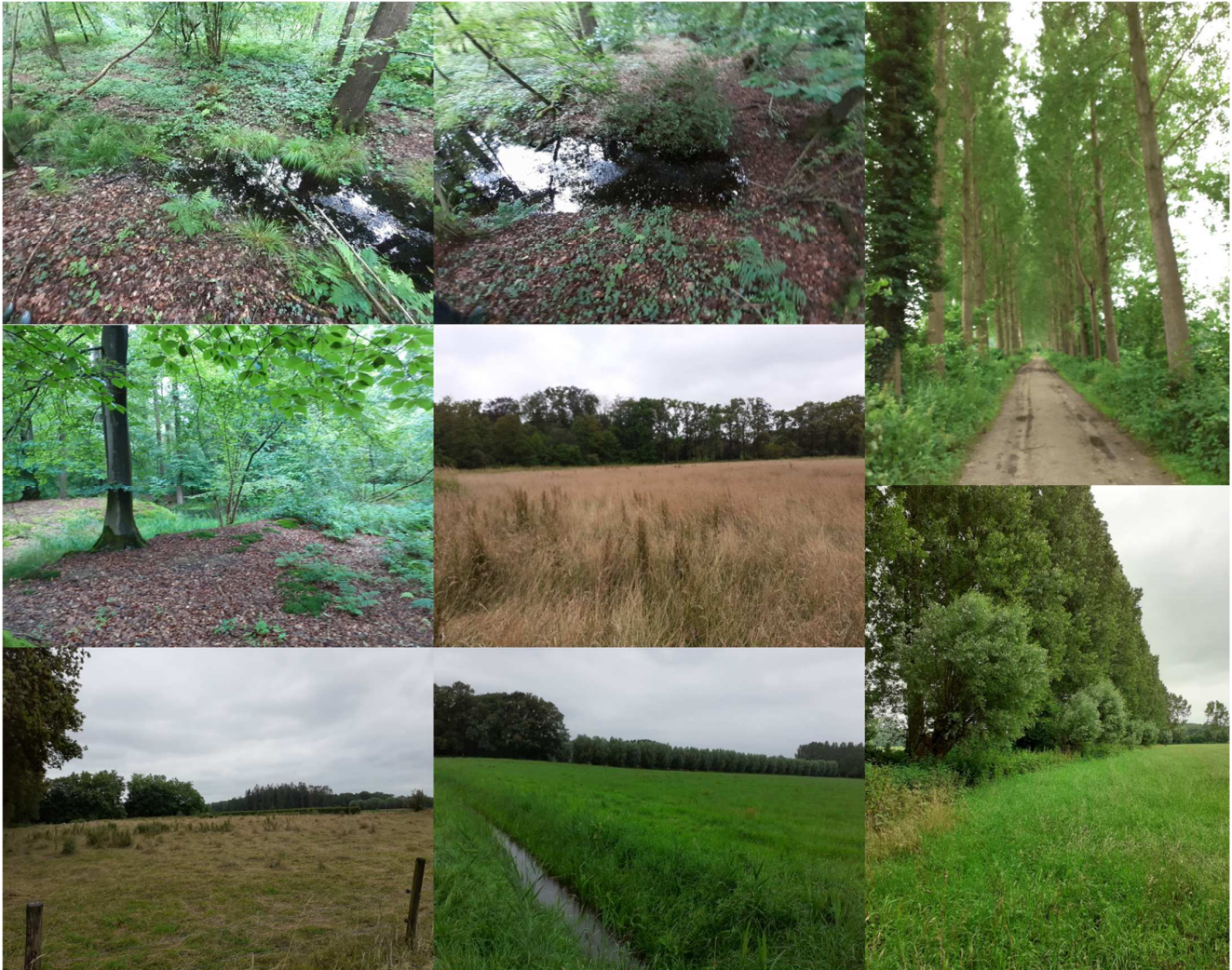
Figuur 2 Foto impressie plangebied