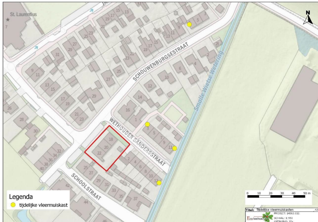
Figuur 1. Locaties tijdelijke vloermuiskasten.