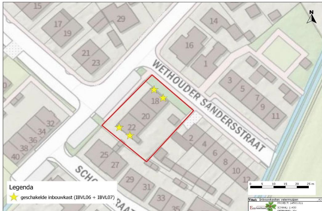
Figuur 2. Locaties permanente vleermuiskasten.