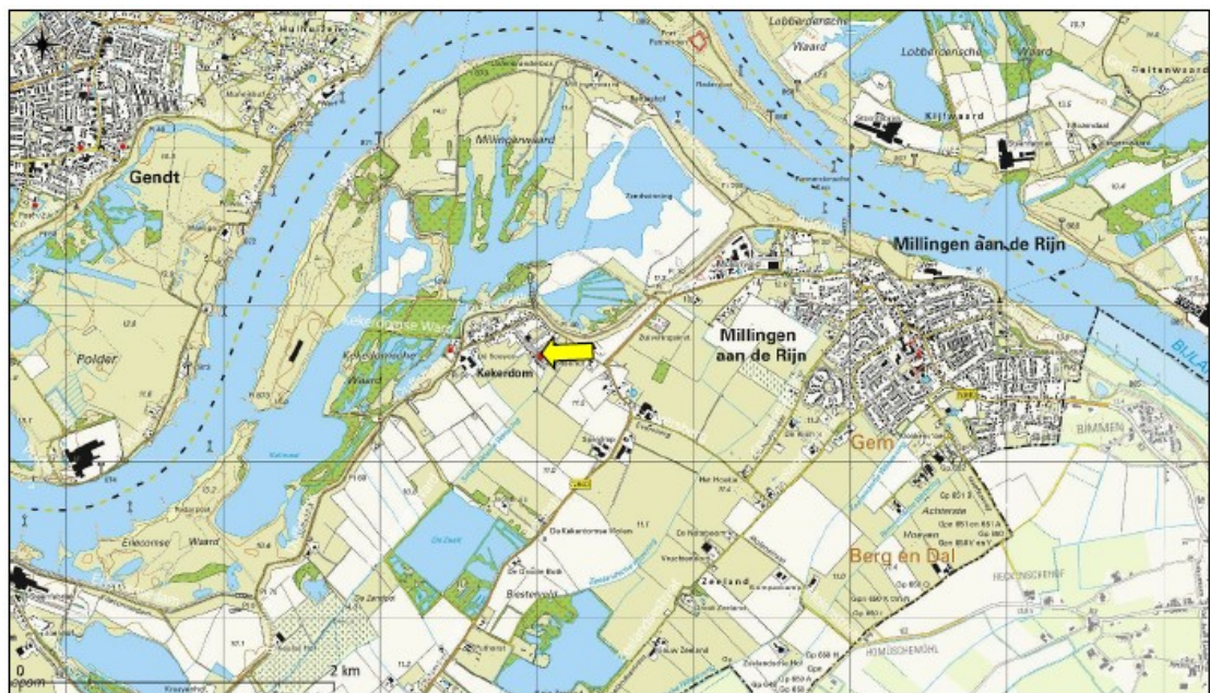
Figuur 1. Topografische ligging projectgebied.